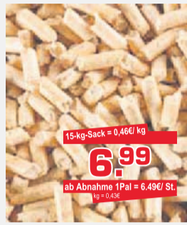
Holzpellets DINplus Premium Qualität in 15 kg-Folien-Sack