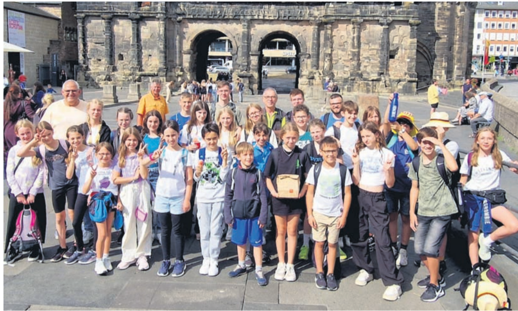
Zu Besuch an der Porta Nigra in Trier.

Bei einer Stadtführung am Sonntag durch Trier am Montag wurde