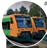
Die Urlaubsregion ARBERLAND im Bayerischen Wald lässt sich ganz bequem mit öffentlichen Verkehrsmitteln erkunden – sogar grenzüberschreitend.

(epr) Das Auto stehen lassen und die Urlaubsregion mit öffentlichen Verkehrsmitteln erkunden? Im ARBERLAND im Bayerischen Wald geht das ganz einfach – sogar grenzüberschreitend. Denn dort gibt es