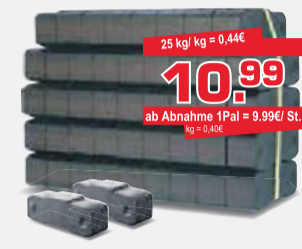
Bündelbriketts aus Braunkohle, handlich gestapelt