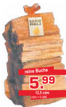
Kaminholz 12,5 dm 3 reines Holzvolumen, im Netz, reine Buche