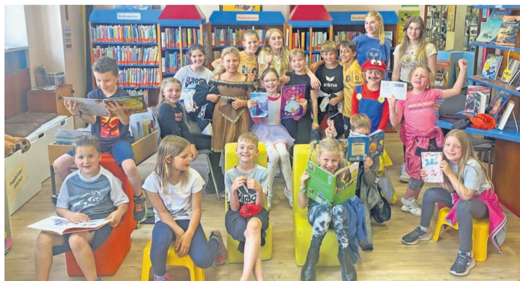
Für die Leseratten unter den Ferienspiel-Kindern gab es einen Ausflug in die Bücherei Münster.

So stand etwa für alle Leseratten unter den Ferienspiel-Kindern ein Besuch in der Bücherei Münster an. Jedes Kind hat sich einen kleinen Baustein für eine Geschichte überlegt, die gemeinsam vor Ort entwickelt und aufgenommen wurde. Dabei gab es viel zu lachen! Außerdem haben sich alle ein Buch ausgesucht, das ihnen gefällt und den ande-