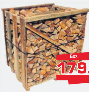
Kaminholz Laub-Nadel-Mix 1RM trocken 30cm