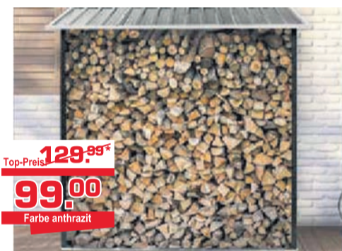
Kaminholzregal Material: Stahlblech, verzinkter Stahl, rostfrei, Größe: 154 x 83 x 157 cm, Vollwandverbreitung / wetterbeständig, Eigengewicht: ca. 15 kg