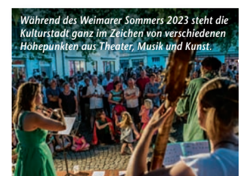
Während des Weimarer Sommers 2023 steht die Kulturstadt ganz im Zeichen von verschiedenen Höhepunkten aus Theater, Musik und Kunst.

Große Namen unter freiem Himmel (epr) Wo der historische Charme der Kulturstadt Weimar auf zeitgenössische Höhepunkte aus Theater, Musik und Kunst trifft, warten ganz besondere Genussmomente auf Besucherinnen und Besucher. Mit idyllischen Parkanlagen, großzügigen Plätzen und lauschigen Gassen bildet die Klassikerstadt die perfekte Kulisse für Theaterexperimente, Performances, Straßenfeste und Konzerte. Im Rahmen des Weimarer Sommers trumpft von Juni bis September die internationale Kulturszene mit spannenden Inszenierungen und Auftritten auf. So laden verschiedene Open-Air-Konzerte auf der Seebühne zu exquisiten Konzerten unter freiem Himmel ein. Allen Bauhaus-Fans seien die Feierlichkeiten rund um den 100. Jahrestag der ersten großen Bauhaus-Ausstellung empfohlen, die 1923 mit dem ersten Experimentaltbau, dem Haus Am Horn, für Furore sorgte. Mit Ausstellungen, Festwochen und einer Bauhaus-Parade im August zollt Weimar diesem Aufbruch in ein neues Zeitalter des Designs und Bauens gebührenden Tribut. Alle Informationen unter www.weimarer-sommer.de