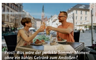
Prost! Was wäre der perfekte Sommer-Moment ohne ein kühles Getränk zum Anstoßen?

(epr) Was braucht es für den perfekten Sommer-Moment? Das Altenburger Land hat die Antwort: eine über 1.000-jährige Geschichte, gastfreundliche Einheimische und regionale Köstlichkeiten! Wer die Region in Thüringen besucht, wird schnell merken: Heimatnähe und gelebte Tradition stehen hier an der Tagesordnung. Wer bspw. an einer öffentlichen Stadtführung teilnimmt, wird nicht nur mit Infos und Geschichten „gefüttert“, sondern darf sich auch an der Verkostung schmackhafter Altenburger Spezialitäten erfreuen. Und ist der Hunger am Ende des Tages noch nicht gestillt, lohnt der Abstecher in eines der ausgezeichneten Restaurants und Gasthäuser. Hier probiert man sich bei gemütlicher Atmosphäre durch saisonale Sommermenüs sowie natürlich durch herzhaft Klassiker der lokalen Küche: Frisch gezapftes Bier, würzige Scheiben Graubrot, eine deftige Portion Sauerkraut und dazu ein saftiges Stück Original Schmöllner Mutzbraten – mmh, so lecker schmeckt das Altenburger Land! Einen Überblick über alles Sehenswerte, Veranstaltungen sowie kulinarische Angebote finden Interessierte unter www.reiseplaza.de/altenburg