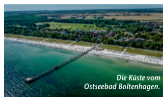
Die Küste vom Ostseebad Boltenhagen.

seit Kurzem ein neues ÖPNV-Tagesticket, das nicht nur im ARBERLAND – dem Landkreis Regen – sowie in den Landkreisen Freyung-Grafenau und Cham gilt, sondern auch in den westlichen Bereichen der Bezirke Pilsen und Südböhmen. Für 17 Euro pro Person und Tag sind damit auch Fahrten ins benachbarte Tschechien möglich, insgesamt können über 400 Verkehrsverbindungen genutzt werden. Und das Beste: Touristinnen und Touristen mit dem kostenlosen Gästeservice Umwelt-Ticket, kurz GUTI, fahren gratis! Der Geltungsbereich des Tickets wurde erweitert und entspricht nun dem Bayerwald-Tagesticket+CZ. Die GUTI-Gästekarte gilt vom Anreisestart bis zum Abreisetag und ermöglicht einen nachhaltigen und verantwortungsbewussten Urlaub. Mehr unter www.reiseplaza.de/arberland