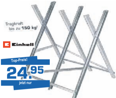
Kettensägebock zusammenklappbar, 3 verschiedene Arbeitshöhen (60/64/68 cm), robuste, verzinkte Metallprofile für max. Ø 30 cm