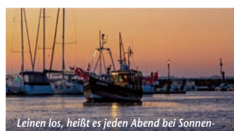
Leinen los, heißt es jeden Abend bei Sonnenuntergang für die Boltenhagener Fischer.

(epr) Eine leichte Brise, Salz in der Luft und rauschende Wellen: Das Meer weckt ein einzigartiges Lebensgefühl. Wer dieses schmerzlich vermisst und den nächsten Strandurlaub kaum erwarten kann, muss längst keinen langen und stressigen Flug mehr antreten. Denn auch an der mecklenburgischen Ostseeküste gibt es feinen, weißen Sandstrand, kristallklares Wasser und etliche Sonnenstunden. Wie wäre es z. B. mit einem Urlaub im Ostseebad Boltenhagen? Hier erwartet die Besucher ein fünf Kilometer langer Strandabschnitt zum Sonnen, Schwimmen, Baden, Tauchen und Seele baumeln lassen. Das Seeheilbad bietet beste Bedingungen für einen Urlaub ganz für sich, zu zweit, mit Freunden oder Kind und Kegel. Unter www.reiseplaza.de/boltenhagen bekommt man alle wichtigen Infos.