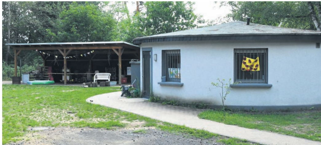
Im Haus Westermann, wo die Gemeinde Eppertshausen derzeit die naturnahe Gruppe der Kita „Sonnenschein“ betreibt, wurden ein Tablet-PC und ein Smartphone geklaut. Dies löste eine administrative Kettenreaktion unter Beteiligung mehrerer Datenschutz-Beauftragter aus.

Eppertshausen (jedö) Auf den ersten Blick war es keine große Nachricht: Mitte Juli brachen Unbekannte ins Haus Westermann nahe dem Eppertshäuser Sportzentrum ein. In dem einst vor allem für Privat- und Vereinsfeiern genutzten Objekt samt Außengelände hat die Gemeinde seit einiger Zeit eine naturnahe Gruppe der (von der Kommune betriebenen) Kita „Sonnenschein“ untergebracht. Dass sich trotz geringen Sachschadens nicht nur die Polizei mit dem Fall befasste, sondern auch das Rathaus eine eigene Mitteilung dazu herausgab, deutete indes auf einen besonderen Umstand hin. Das Stichwort lautet Datenschutz.