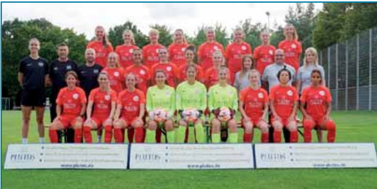
OFC Frauen im DFB Pokal

Erstmals spielen die Frauen von Kickers Offenbach im DFB Pokal mit. Gegner in der 1. Runde ist der Südwest Regionalligist 1. FC Riegelsberg. Anpfiff im Sana Sportpark ist am Sonntag der 13.08. um 14 Uhr in Offenbach.