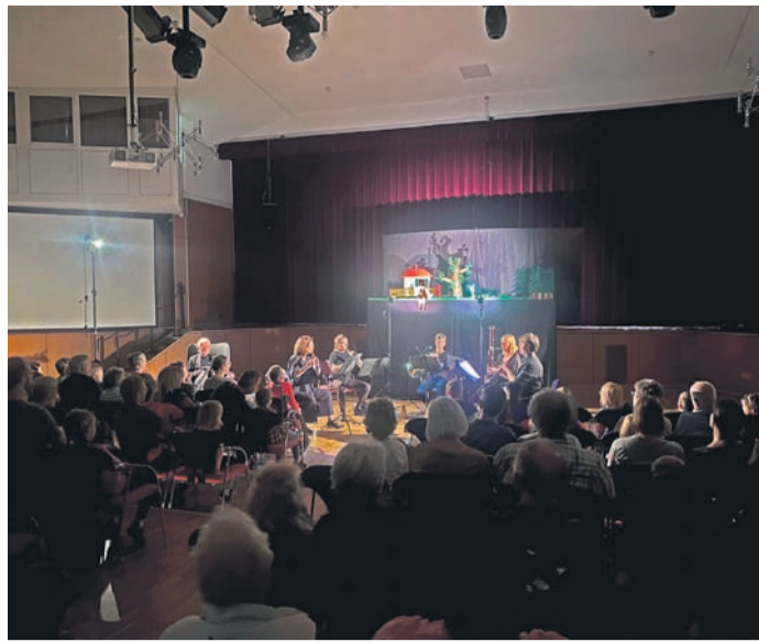
Eine Kombination aus Geschichtenerzählung, Musik und Puppenspiel war die Aufführung von „Peter und der Wolf“ am vergangenen Sonntag in der Kulturhalle Münster.

Falls Sie dieses Produkt nicht mehr erhalten möchten, bitten wir Sie, einen Werbebotsaufkleber mit dem Zusatzhinweis „Keine kostenlosen Zeitungen“ an Ihrem Briefkasten anzubringen. Weitere Informationen finden Sie auf dem Verbraucherportal www.werbung-im-briefkasten.de