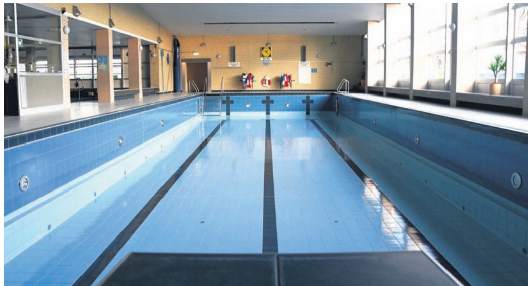
Seit fünf Jahren ohne Wasser: das leere Schwimmerbecken des Münsterer Hallenbads.

Münster (jedö) Seit Sommer 2018 ist das Münsterer Hallenbad wegen etlicher technischer und baulicher Mängel geschlossen. Seine Nutzer und alle, die es mal werden wollten, müssen sich nun wohl damit abfinden, dass sie in der Gersprenz-Gemeinde auch künftig nicht mehr schwimmen können: Nach der gescheiterten Suche nach einem privaten Investor in den vergangenen Wochen ist der Traum vom neuen Bad nahezu sicher ausgeträumt. Die vermeintlichen anderen Lösungsalternativen sind bei näherem Hinsehen unrealistisch.