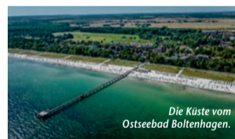
Die Küste vom Ostseebad Boltenhagen.

seit Kurzem ein neues ÖPNV-Tagesticket, das nicht nur im ARBERLAND – dem Landkreis Regen – sowie in den Landkreisen Freyung-Grafenau und Cham gilt, sondern auch in den westlichen Bereichen der Bezirke Pilsen und Südböhmen. Für 17 Euro pro Person und Tag sind damit auch Fahrten ins benachbarte Tschechien möglich, insgesamt können über 400 Verkehrsverbindungen genutzt werden. Und das Beste: Touristinnen und Touristen mit dem kostenlosen Gästeservice Umwelt-Ticket, kurz GUTi, fahren gratis! Der Geltungsbereich des Tickets wurde erweitert und entspricht nun dem Bayerwald-Tagesticket+CZ. Die GUTi-Gästekarte gilt vom Anreisestag zum Abreisetag und ermöglicht einen nachhaltigen und verantwortungsbewussten Urlaub. Mehr unter www.reiseplaza.de/arberland