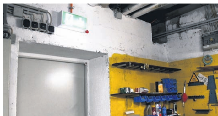
Mängel wie dieses gegen den Brandschutz verstoßene Loch in der Wand (im Bild rechts oben neben der Notausgangs-Beleuchtung über der Brandschutztür) haben dem Münsterer Hallenbad 2018 den Garaus gemacht.

Trotzdem sei er „noch nicht so weit, das Thema Hallenbad zu begraben“, fügt der Bürgermeister an. Einen neuen Plan hat er jetzt aber nicht mehr, es regiert nur noch das Prinzip Hoffnung: „Meine Großmutter hat immer gesagt: Wenn du glaubst, es geht nicht mehr, kommt irgendwo ein Lichtlein her.“ Eine Verwaltungsvorlage pro Abriss des alten Bads (der den Haushalt im hohen sechsstelligen Bereich belasten dürfte) ist erstmal nicht geplant.