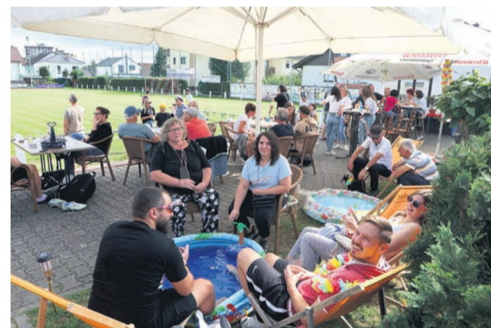
Bis zu den Regenschauern am Abend herrschte bei den „TSummerfeelings“ auch Sommerwetter.

Am Sonntag, 13. August, beginnt der Schlusstag des TS-Sommergartens wieder mit einem rustikalen Speck & Eier Frühstück und nach den Punktspielen der dritten und zweiten Mannschaft läutet um 21.30 Uhr die Schlussglocke zur „letzten Runde“.