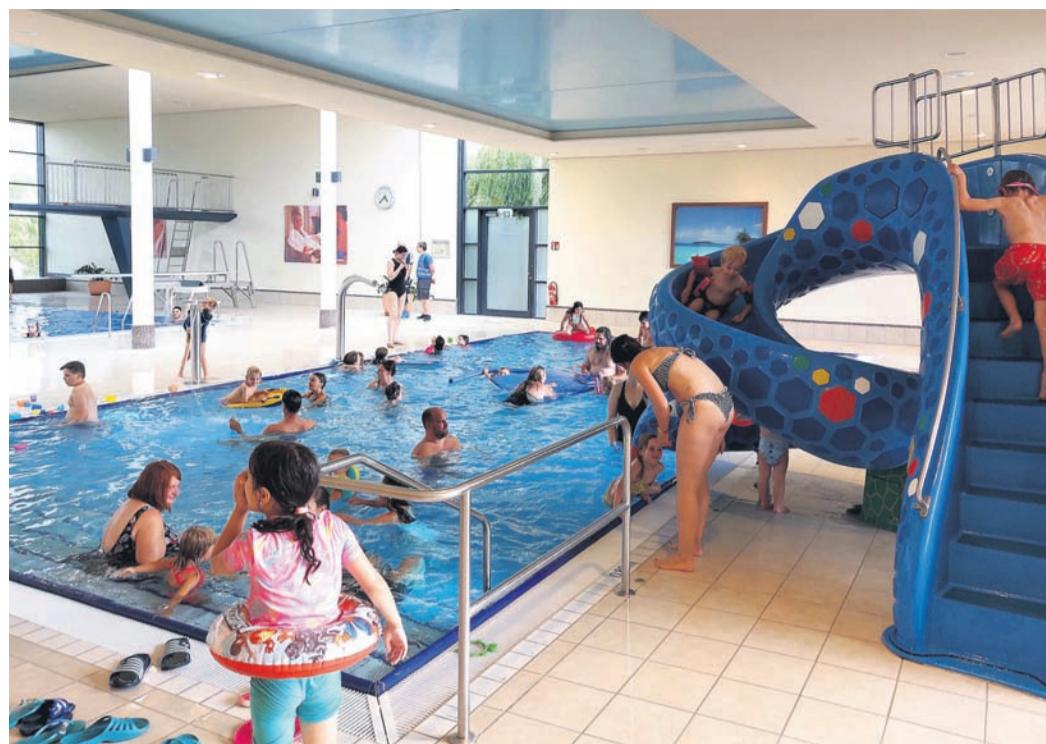
Regener Betrieb an einem „Fun & Action“-Dienstag im Badehaus. Das regnerische Wetter der ersten Ferienwochen hat dem Trend zu steigenden Besucherzahlen zusätzlich Auftrieb gegeben.

In zwei Beschlüssen hat die Stadtverordnetenversammlung dafür votiert, die Realisierung eines Neubaus und aber auch die Nutzung der eigenen Räume im Badehaus zu prüfen. Dabei ist festzuhalten, dass der Neubau wesentlich höhere Kosten verursachen würde. Bei der Nutzung der bereits vorhandenen stadteigenen Räume würden die Umbaukosten eventuell durch die Fördermittel des Landes weitgehend abgedeckt werden können. „Eine Prüfung dieser Möglichkeit ist deshalb aus unserer Sicht zwingend notwendig. Wir müssen aber auch gleichzeitig nach einer Alternative für die Saunaritter suchen, damit diese Rödermark auch zukünftig erhalten bleiben“, verdeutlicht CDU-Fraktionsvorsitzender Michael Gensert.