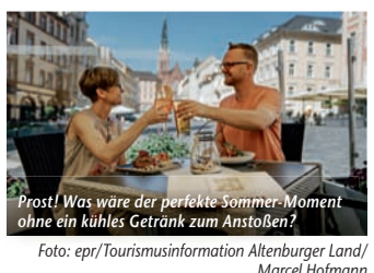
Prost! Was wäre der perfekte Sommer-Moment ohne ein kühles Getränk zum Anstoßen?

Sommer mit Genuss-Highlights – Im Altenburger Land geben sich Kultur und Kulinarik die Hand (epr) Was braucht es für den perfekten Sommer-Moment? Das Altenburger Land hat die Antwort: eine über 1.000-jährige Geschichte, gastfreundliche Einheimische und regionale Köstlichkeiten! Wer die Region in Thüringen besucht, wird schnell merken: Heimatnähe und gelebte Tradition stehen hier an der Tagesordnung. Wer bspw. an einer öffentlichen Stadtführung teilnimmt, wird nicht nur mit Infos und Geschichten „gefüttert“, sondern darf sich auch an der Verkostung schmackhafter Altenburger Spezialitäten erfreuen. Und ist der Hunger am Ende des Tages noch nicht gestillt, lohnt der Abstecher in eines der ausgezeichneten Restaurants und Gasthäuser. Hier probiert man sich bei gemütlicher Atmosphäre durch saisonale Sommermenüs sowie natürlich durch herzhaft Klassiker der lokalen Küche: Frisch gezapftes Bier, würzige Scheiben Graubrot, eine deftige Portion Sauerkraut und dazu ein saftiges Stück Original Schmöllner Mutzbraten – mmh, so lecker schmeckt das Altenburger Land! Einen Überblick über alles Sehenswerte, Veranstaltungen sowie kulinarische Angebote finden Interessierte unter www.reiseplaza.de/altenburg