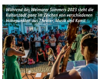
Während des Weimarer Sommers 2023 steht die Kulturstadt ganz im Zeichen von verschiedenen Höhepunkten aus Theater, Musik und Kunst.

Kultur zwischen Klassik und Moderne – Weimarer Sommer 2023: Große Namen unter freiem Himmel (epr) Wo der historische Charme der Kulturstadt Weimar auf zeitgenössische Höhepunkte aus Theater, Musik und Kunst trifft, warten ganz besondere Genussmomente auf Besucherinnen und Besucher. Mit idyllischen Parkanlagen, großzügigen Plätzen und lauschigen Gassen bildet die Klassikerstadt die perfekte Kulisse für Theaterexperimente, Performances, Straßenfeste und Konzerte. Im Rahmen des Weimarer Sommers trumpt von Juni bis September die internationale Kulturszene mit spannenden Inszenierungen und Auftritten auf. So laden verschiedene Open-Air-Konzerte auf der Seebühne zu exquisiten Konzerten unter freiem Himmel ein. Allen Bauhaus-Fans seien die Feierlichkeiten rund um den 100. Jahrestag der ersten großen Bauhaus-Ausstellung empfohlen, die 1923 mit dem ersten Experimentaltbau, dem Haus Am Horn, für Furore sorgte. Mit Ausstellungen, Festwochen und einer Bauhaus-Parade im August zollt Weimar diesem Aufbruch in ein neues Zeitalter des Designs und Bauens gebührenden Tribut. Alle Informationen unter www.weimarer-sommer.de