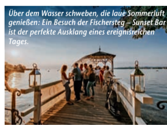
Über dem Wasser schweben, die laue Sommerluft genießen: Ein Besuch der Fischersteig – Sunset Bar ist der perfekte Ausklang eines ereignisreichen Tages.

Best of Bregenz – Wo Highlights aus Natur, Kultur und Kulinarik zusammenkommen, warten unvergessliche Urlaubserinnerungen (epr) Im Vierländereck zwischen Alpen und Bodensee lädt die Vorarlberger Landeshauptstadt Bregenz zu abwechslungsreichen Streifzügen durch die malerische Umgebung ein. So können Radfahrfreunde, Badegäste und Spaziergänger z. B. die Pipeline zwischen dem