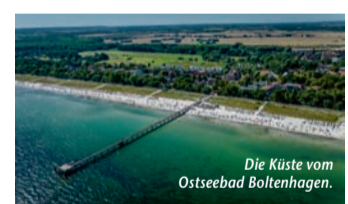
Die Küste vom Ostseebad Boltenhagen.

seit Kurzem ein neues ÖPNV-Tagesticket, das nicht nur im ARBERLAND – dem Landkreis Regen – sowie in den Landkreisen Freyung-Grafenau und Cham gilt, sondern auch in den westlichen Bereichen der Bezirke Pilsen und Südböhmen. Für 17 Euro pro Person und Tag sind damit auch Fahrten ins benachbarte Tschechien möglich, insgesamt können über 400 Verkehrsverbindungen genutzt werden. Und das Beste: Touristinnen und Touristen mit dem kostenlosen Gästeservice Umwelt-Ticket, kurz GUTI, fahren gratis! Der Geltungsbereich des Tickets wurde erweitert und entspricht nun dem Bayerwald-Tagesticket+CZ. Die GUTI-Gästekarte gilt vom Anreisetag zum Abreisetag und ermöglicht einen nachhaltigen und verantwortungsbewussten Urlaub. Mehr unter www.reiseplaza.de/arberland