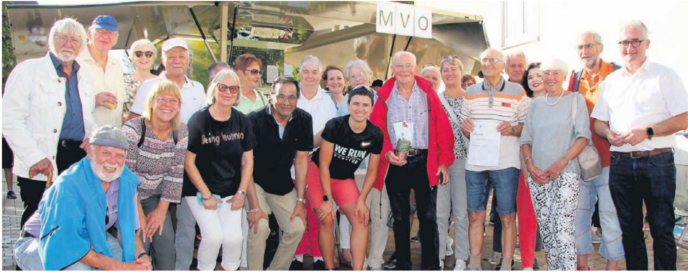
Die ausgezeichneten Radler des Stadtradelns.