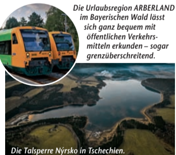
Die Urlaubsregion ARBERLAND im Bayerischen Wald lässt sich ganz bequem mit öffentlichen Verkehrsmitteln erkunden – sogar grenzüberschreitend.

Urlaub – nachhaltig und grenzüberschreitend – Mit Bus und Bahn unterwegs in Bayern und Böhmen (epr) Das Auto stehen lassen und die Urlaubsregion mit öffentlichen Verkehrsmitteln erkunden? Im ARBERLAND im Bayerischen Wald geht das ganz einfach – sogar grenzüberschreitend. Denn dort gibt es