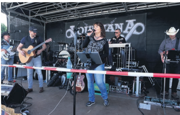
Die Band „Louisiana on Tour“ ist beim Country-Frühschoppen seit Anfang an dabei.