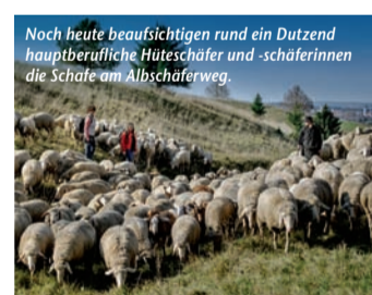
Noch heute beaufsichtigen rund ein Dutzend hauptberufliche Hüteschäfer und -schäferinnen die Schafe am Albschäferweg.

Bregener Hafen und Lochau entlangradeln bzw. -flanieren. Hier warten nicht nur ein separater Fahrrad- und Fußgängerweg; auch der Uferbereich wurde in einen einladenden Strandabschnitt mit eigenem Badesteg verwandelt. In der weitgehend autofreien Innenstadt bummeln Besucher in der größten Fußgänger- und Begegnungszone Vorarlbergs nach Herzenslust durch Modehäuser, Boutiquen und Concept Stores oder lassen sich kulinarische Köstlichkeiten in den zahlreichen Cafés, Bars und Backstuben auf der Zunge zergehen. Sommerlicher Hochgenuss sind die alljährlichen Bregener Festspiele, die uns in 2023 mit Giacomo Puccinis Meisterwerk „Madame Butterfly“ in eine magische Welt aus japanisch inspirierten Bühnenbildern, fulminanten Klängen und emotionalen Achterbahnfahrten entführen. Mehr unter www.reiseplaza.de/bregenz