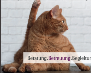
Beratung, Betreuung, Begleitung

Bei uns wird nichts über das Knie gebrochen. Wir nehmen uns Zeit für die persönliche Beratung.