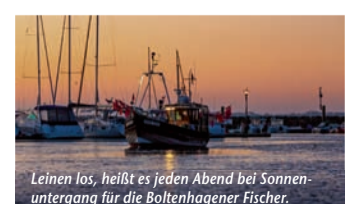
Leinen los, heißt es jeden Abend bei Sonnenuntergang für die Boltenhagener Fischer.

Sandstrand, Salzwasser und Sonnenuntergänge – Im Ostseebad Boltenhagen ganz einfach die Sehnsucht nach Meer stillen (epr) Eine leichte Brise, Salz in der Luft und rauschende Wellen: Das Meer weckt ein einzigartiges Lebensgefühl. Wer dieses schmerzlich vermisst und den nächsten Strandurlaub kaum erwarten kann, muss längst keinen langen und stressigen Flug mehr antreten. Denn auch an der mecklenburgischen Ostseeküste gibt es feinen, weißen Sandstrand, kristallklares Wasser und etliche Sonnenstunden. Wie wäre es z. B. mit einem Urlaub im Ostseebad Boltenhagen? Hier erwartet die Besucher ein fünf Kilometer langer Strandausschnitt zum Sonnen, Schwimmen, Baden, Tauchen und Seele baumeln lassen. Das Seeheilbad bietet beste Bedingungen für einen Urlaub ganz für sich, zu zweit, mit Freunden oder Kind und Kegel. Unter www.reiseplaza.de/boltenhagen bekommt man alle wichtigen Infos.