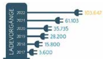
Entwicklung der Ladevorgänge an den geförderten ENTEGA-Ladesäulen

Darüber hinaus zeigt die kostenlose „Easy Charging Quality“-App alle Ladeoptionen in der Nähe des aktuellen Standorts an und kann ebenfalls zum Laden an allen ENTEGA-Ladesäulen genutzt werden. Die App gibt außerdem tagesaktuelle Auskunft über sämtliche Konditionen an den Ladepunkten der ENTEGA-Roamingpartner. Hier können die Preise im Vergleich zu den Konditionen an den ENTEGA-Ladesäulen abweichen. PM