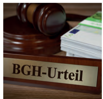
Starkes Urteil für Versicherte.

Bei einem Widerruf erhalten Sie – anders als bei der Kündigung – alle eingezahlten Beiträge ohne Abzug von Maklerprovisionen und Ver- waltungskosten zurück. Und nicht nur das: Die Versicherung muss Sie auch an dem mit Ihrem Geld erzielt Anlagegewinn beteiligen. So können Sie bis zu 150 % der ein- gezahlten Beiträge zurückholen. Ein sattes Plus auf Ihrem Konto winkt!