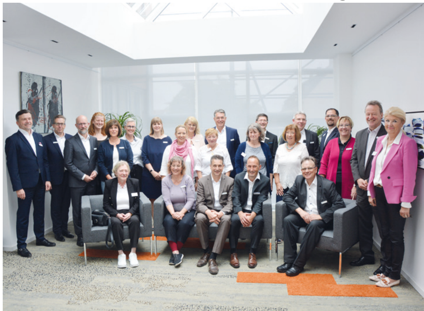
Die Jubilare 2023 und der Vorstand der Volksbank Darmstadt – Südhessen blickten gemeinsam auf bewegte Jahre zurück.