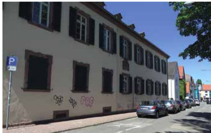
Unscheinbar und mit Kritzeleien besprüht beherbergt das Schloss das Heimatmuseum.

lich ein prunkvolles Anwesen des Adels, erlitt das frühneuzeitliche Schloss während des Zweiten Weltkriegs schweren Schaden durch Fliegerbomben. Das barocke Gebäude wurde danach nicht mehr im alten Stil wiederaufgebaut. Heute beherbergt es das Heimatmuseum sowie den Verein "Heddemer Käwwern e.V.". Da das Schloss dringend renovierungsbedürftig ist, setzt sich der Bürgerverein für seine Wiederbelebung ein. Mit dem Wunsch nach einem Bürgertreffpunkt und Veranstaltungssaal hoffen sie darauf, dass das Schloss bald wieder in neuem Glanz erstrahlt.