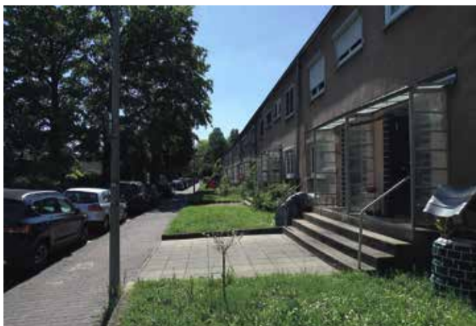
Die „Römersiedlung“ in Hedderheim überzeugt mit ihren grünen Vorgärten.

Das Hedderheimer Schloss in Alt-Hedderheim mag äußerlich unscheinbar wirken, aber es birgt eine reiche Geschichte. Ursprüng-