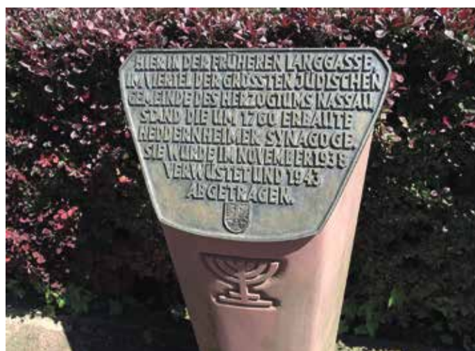
Diese Gedenktafel gedenkt der Hedderheimer Synagoge die 1943 abgerissen wurde.

Neben all dem Spaß und Karneval erinnert eine Gedenktafel in Hedderheim an ein düsteres Kapitel der Geschichte. In Hedderheim existierte bis 1938/42 eine jüdische Gemeinde, deren Ursprünge bis ins 16./17. Jahrhundert zurückreichen. Bereits im Mittelalter lebten jüdische Familien in der Gegend, der alte Friedhof stammt sogar aus dem