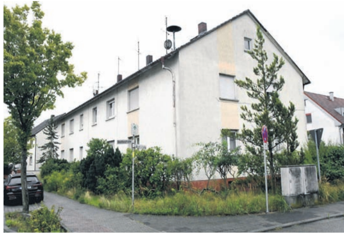
Unter anderem in diesem Gebäude an der Ecke von Goethe- und Iglauer Straße unterhält die Gemeinde Münster mehrere preislich geförderte Wohnungen.

Münster (jedö) Bezahlbarer Wohnraum, wie ihn gerade in Ballungszentren immer öfter vor allem noch Baugenossenschaften und Kommunen zur Verfügung stellen, ist extrem gefragt. In einer Melange aus hohen Mieten, allgemeiner Teuerung, schleppendem Neubau und wegfallender Sozialbindung von Bestandsobjekten hält Münster derzeit mit 106 Gemeindewohnungen dagegen. 105 davon sind aktuell belegt, „wir haben nur einen Leerstand“, sagt Meike Mittmeyer-Riehl, Pressesprecherin der 14.000-Einwohner-Kommune.