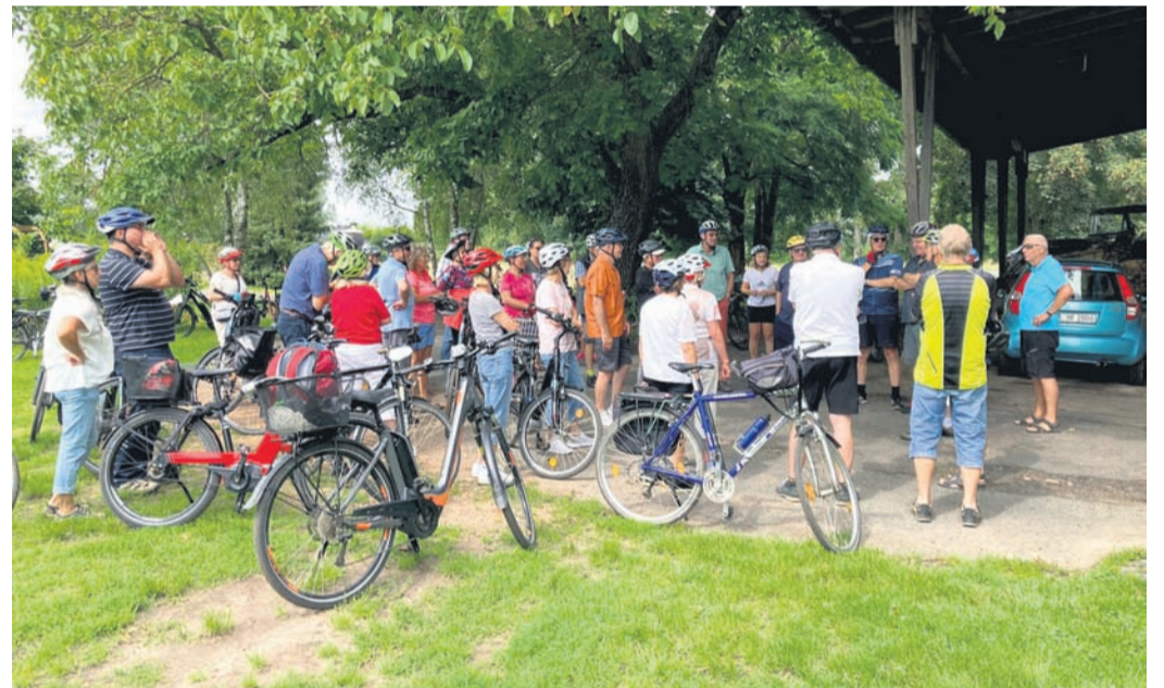
Fast 40 Teilnehmer zählte die radelnde Gruppe, die dann über Nebenstrecken, Feld- und Waldwege die ehemaligen Mühlen aufsuchte.

Das Ziel, die Lohmühle, die jetzt als Weingut betrieben wird erreichte man nach zwei Stunden Exkursion. Noch eine kurze Erläuterung, auch zum bekannten Müller und Turmuhrbauer Ritzert, dann konnten sich die Mannschaft bei Brezeln, Käse und Wein stärken. Die Lohmühle hatte, trotz Urlaub, extra für die Eppertshäuser Gäste eine Ausnahme gemacht und geöffnet. Nach einer ausgiebigen Rast strebten die Radfahrer nach einem lehrreichen Tag der Heimat entge-