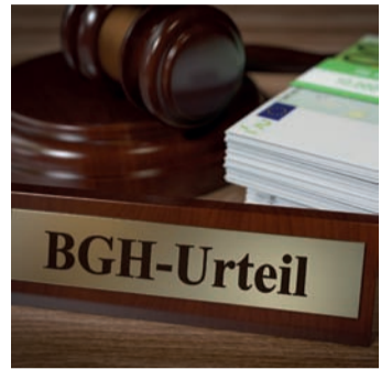
Starkes Urteil für Versicherte.

Bei einem Widerruf erhalten Sie – anders als bei der Kündigung – alle eingezahlten Beiträge ohne Abzug von Maklerprovisionen und Verwaltungskosten zurück. Und nicht nur das: Die Versicherung muss Sie auch an dem mit Ihrem Geld erzielten Anlagegewinn beteiligen. So können Sie bis zu 150 % der eingezahlten Beiträge zurückholen. Ein sattes Plus auf Ihrem Konto winkt!