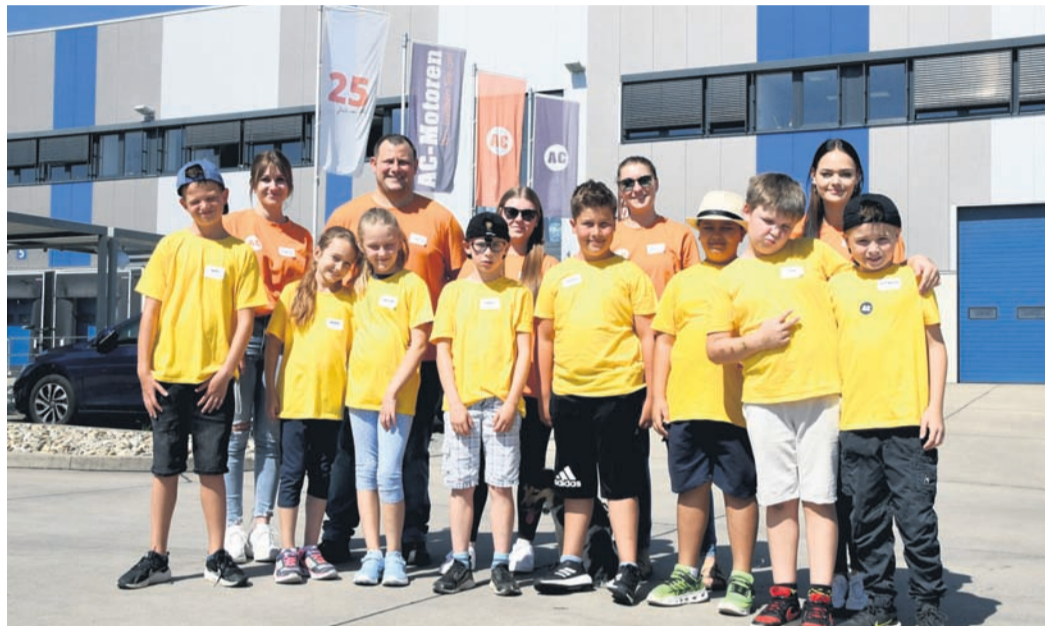
Diese Kinder waren beim Auftakt der Eppertshäuser Ferienfreizeit dabei. Er führte sie am Freitag zur Firma AC-Motoren in den „Park45“.