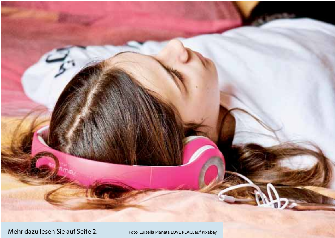
Mehr dazu lesen Sie auf Seite 2.