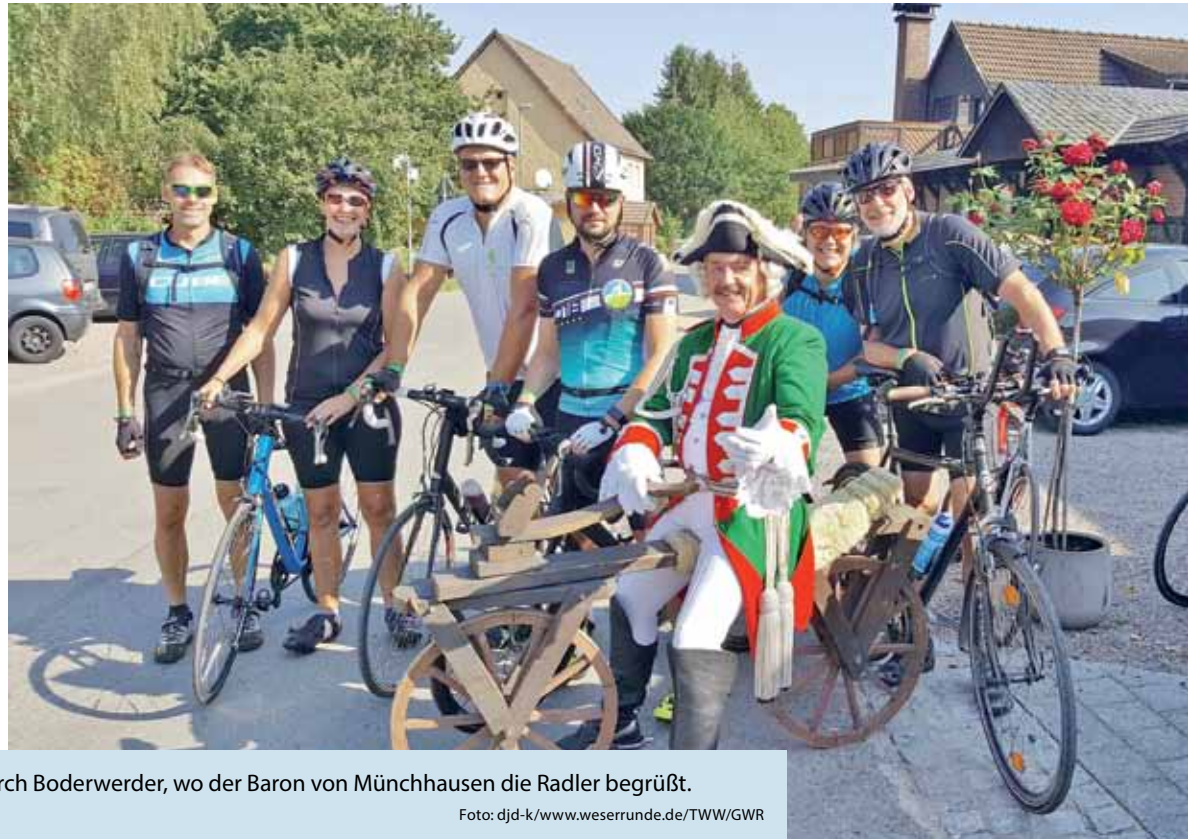
Die Große Weserrunde führt auch durch Boderwerder, wo der Baron von Münchhausen die Radler begrüßt.

(DJD-K). Die Große Weserrunde ist ein Radmarathon für Hobbyfahrer, der überwiegend auf dem Weser-Radweg verläuft. Vergleichbar mit populären Wandermarathons starten am 26. August alle Teilnehmenden in Rinteln, hier befindet sich auch das Ziel. Sie können unterschiedliche Streckenlängen wählen für ihre gesellige Tour durchs reizvolle Weserbergland, vorbei an Schlössern, Burgen und Fachwerkstädtchen wie Hameln, wo der weltberühmte Rattenfänger sie schon erwartet. Unter www.weserrunde.de gibt es Impressionen und Informationen. Der Weser-Radweg wurde bei der Radreiseanalyse des Allgemeinen Deutschen Fahrradclubs (ADFC) erneut als Deutschlands beliebtester Radfernweg ausgezeichnet. Rund um diese Qualitätsradroute ist im Weserbergland eine erstklassige Infrastruktur für Fahrradurlauber entstanden.