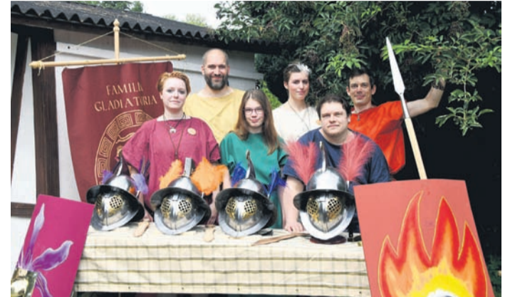
Beim 45. Münsterer Volkswandern stellte sich im Biergarten der Wandergesellschaft Frisch Auf auch die Gladiatorengruppe des Vereins vor.

verein, dem VfL, dem Kirchenchor und dem Schützenverein Waidmannsheil brachte ein halbes Dutzend weiterer Münsterer Vereine eine zweistellige Zahl an Leuten auf die Wege. Von einem zweistelligen Zuspruch bei ihren Treffen sind zwei Gruppen der Wandergesellschaft Frisch Auf Münster derzeit etwas entfernt, üben ihre Hobbys dessen ungeachtet aber weiter aus und präsent-