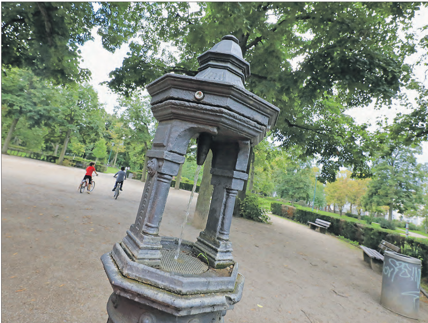
IM BERTIEB ist aktuell dieser Trinkbrunnen im Herrngarten.