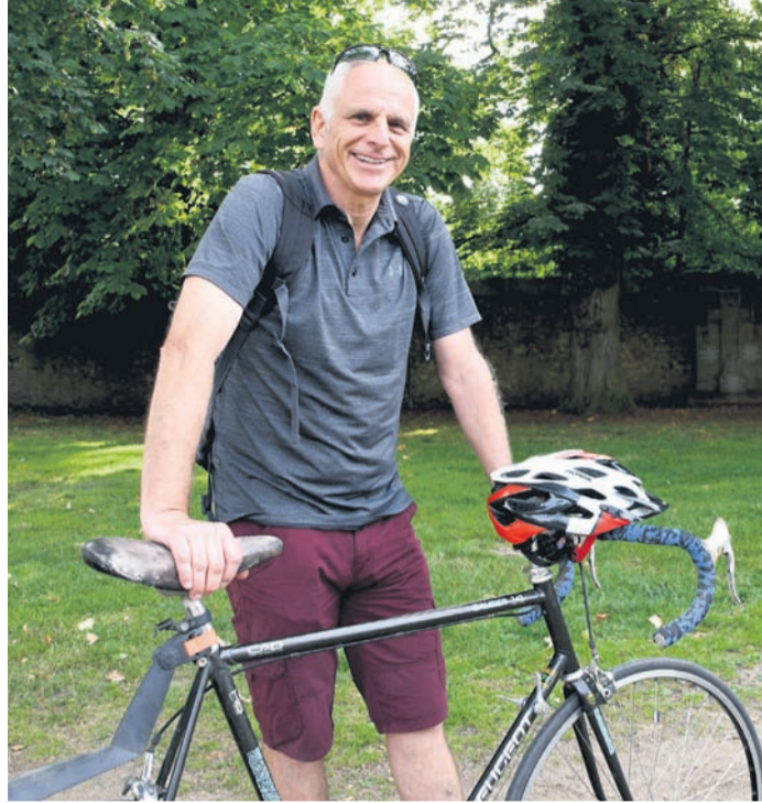
Genießt seine Freiheit, oft auf dem Rad: Münsters Ex-Bürgermeister Gerald Frank.

Auf die kommunalpolitische Bühne sind Sie nach einiger Zeit zurückgekehrt: als Nachrücker der SPD-Fraktion im