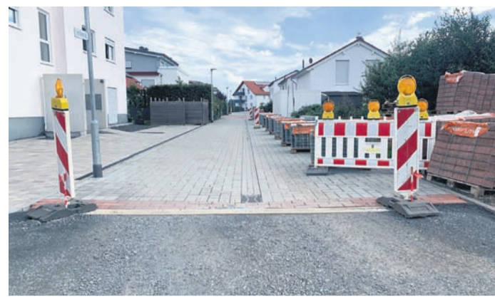
Blick ins Wohngebiet, wo bereits das finale Pflaster aufgetragen wurde. In den nächsten Wochen stehen Fräs- und Asphaltarbeiten an.

Bisher standen Tiefbauarbeiten zur Verlegung von Kabeln und Pflasterarbeiten für die Verkehrswege auf dem Programm. Im nächsten Schritt sollen die Straßen „Auf der Beune“, „Friedrich-Ebert-Straße“ (nördlich vom Kreisel) und „Im Seerich“ asphaltiert werden. Dabei wird zur Vorbereitung die zurzeit noch vorhandene Baustraße herausgefräst und anschließend eine neue Asphaltdecke eingebracht. Die Fräsarbeiten finden voraussichtlich in der Kalenderwoche 36 (ab dem 4. September) statt. In dieser Zeit sind die betroffenen Straßen nur halbseitig befahrbar.