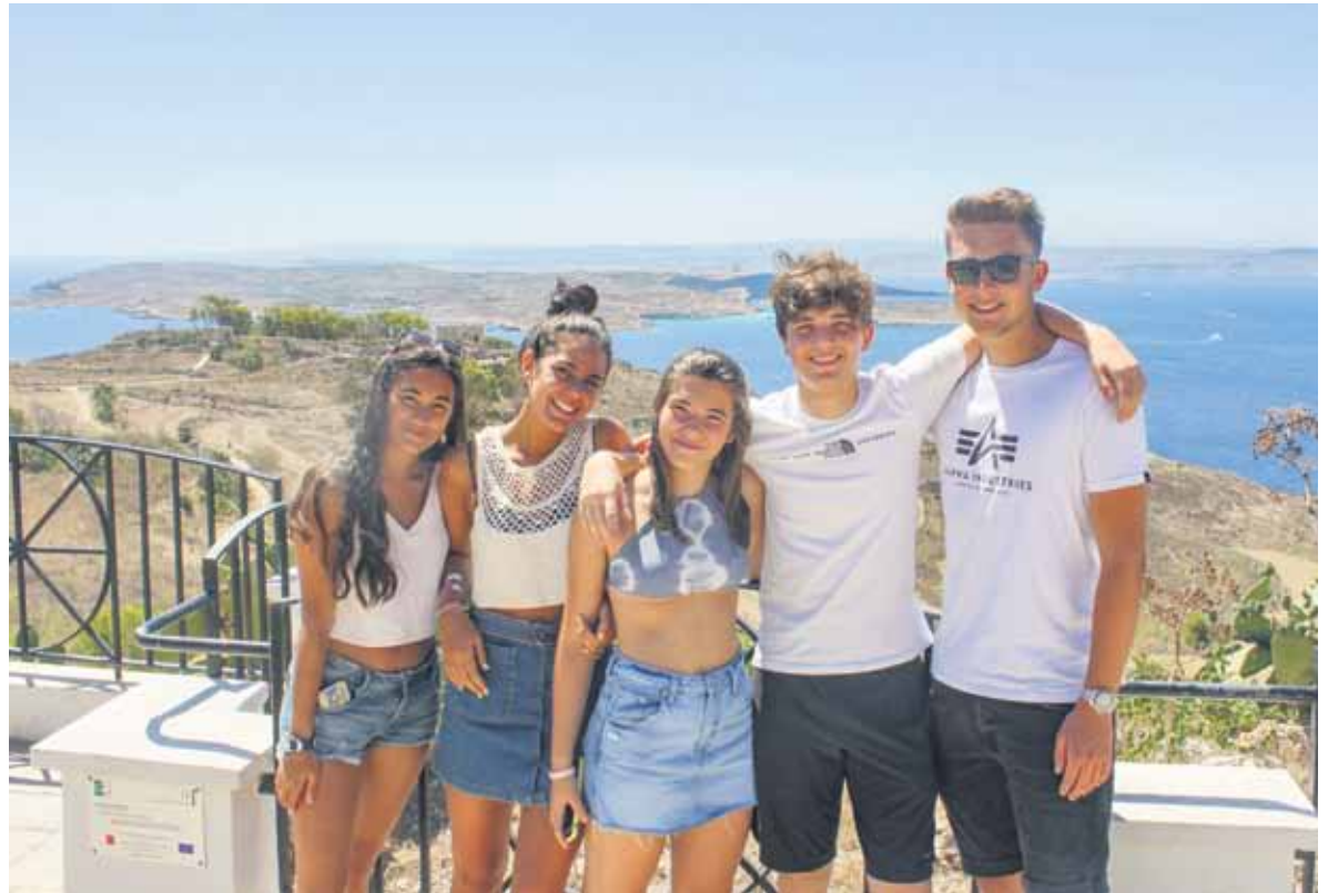
Es gibt viele Gründe, um nach Malta zu fahren - zum Beispiel die kleine Insel Comino, die im Hintergrund zu sehen ist.