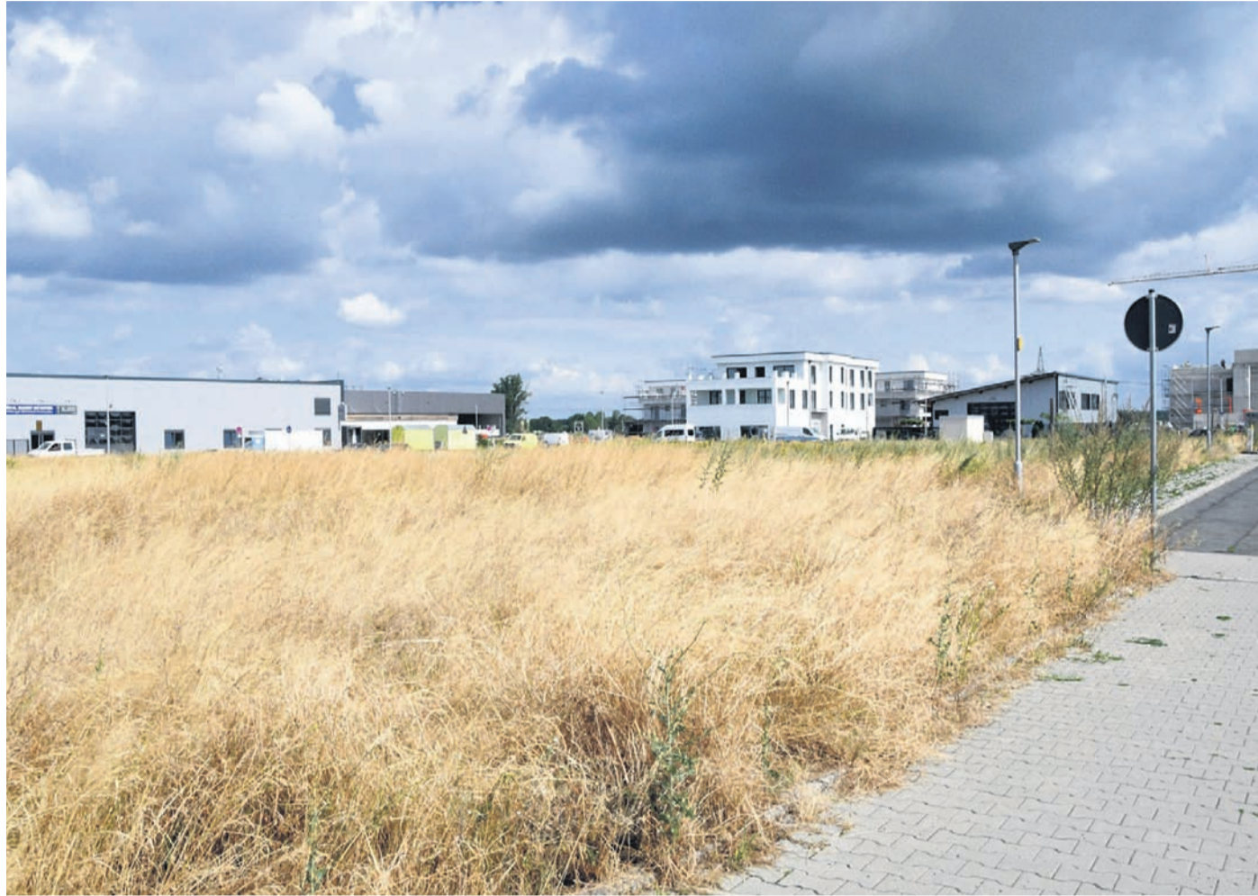
Auf dem Feldkreuz-Grundstück im Münsterer Baugebiet „Am Seerich“ entsteht ein Netto-Markt mit 22 Wohnungen obendrauf.

Vor allem das Feldkreuz-Grundstück, gelegen direkt am Feuerwehr-Kreisel als zentraler Zufahrt ins Seerich-Gebiet, ist von öffentlichem Interesse. Dort will die Schoofs Immobilien GmbH aus Frankfurt einen Lebensmittelmarkt mit 22 oben draufgesetzten Wohnungen bauen und dazu 84 oberirdische Stellplätze errich-