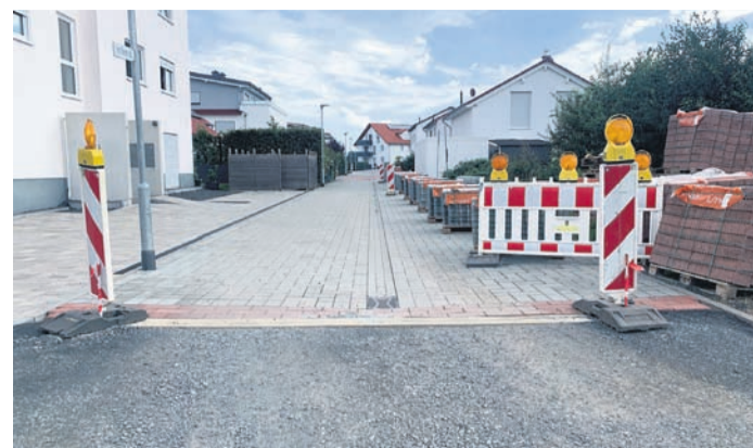
Blick ins Wohngebiet, wo bereits das finale Pflaster aufgetragen wurde. In den nächsten Wochen stehen Fräs- und Asphaltarbeiten an.

Bisher standen Tiefbauarbeiten zur Verlegung von Kabeln und Pflasterarbeiten für die Verkehrswege auf dem Programm. Im nächsten Schritt sollen die Straßen „Auf der Beune“, „Friedrich-Ebert-Straße“ (nördlich vom Kreisel) und „Im Seerich“ asphaltiert werden. Dabei wird zur Vorbereitung die zurzeit noch vorhandene Baustraße herausgefräst und anschließend eine neue Asphaltdecke eingezogen. Die Fräsarbeiten finden voraussichtlich in der Kalenderwoche 36 (ab dem 4. September) statt. In dieser Zeit sind die betroffenen Straßen nur halbseitig befahrbar.