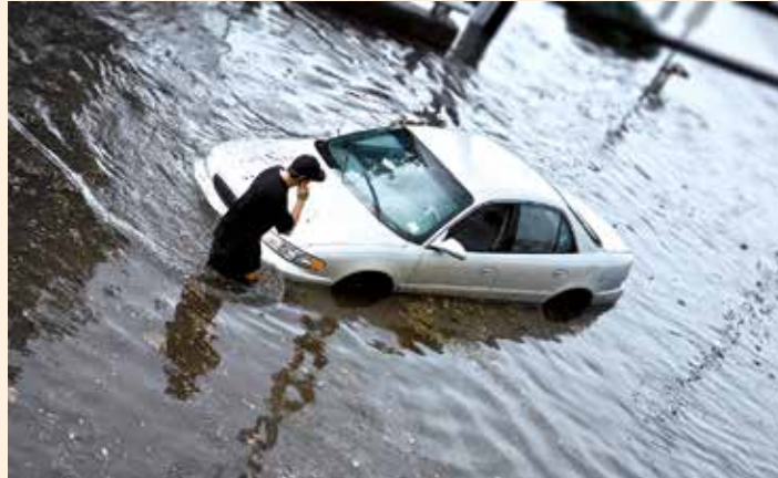
Überflutete Straßenabschnitten sollten unbedingt mit dem Auto vermieden werden. Denn wenn größere Mengen Wasser in den Motor geraten, ist dieser in der Regel defekt.

Wer mit seinem Fahrzeug bei Starkregen unterwegs ist und sich überfluteten Straßenabschnitten nähert, sollte unbedingt anhalten, keinesfalls weiterfahren, am besten wenden. Ist