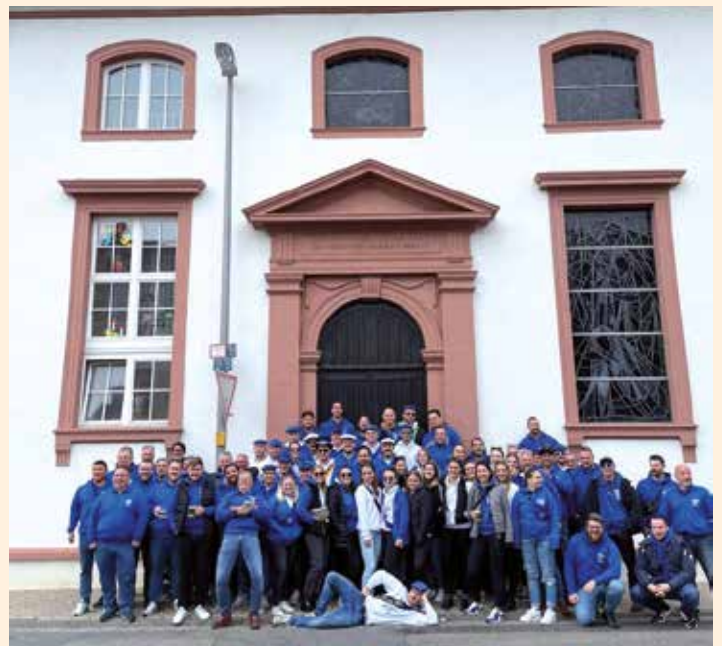
Gruppenbild mit den aktiven Kerwemädscher und Kerweborsch so wie den Alt-Kerweborsch.

Den Dornemern eine „Farbenfrohe Kerb“ wünscht