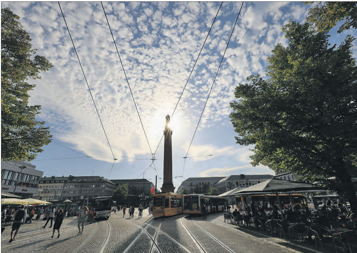
Wie wird sich das Klima in Darmstadt entwickeln?