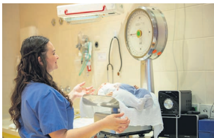
Hebamme mit Säugling.

Langen (RZ) Ab sofort beteiligt sich die Asklepios Klinik Langen an einem Wiedereinstiegsprogramm für Hebammen, das vom Frankfurter Bürgerhospital ins Leben gerufen wurde. Ziel des Modellprojekts ist es, Hebammen, die lange nicht mehr in ihrem Beruf gearbeitet haben oder im ambulanten Bereich tätig sind, dauerhaft für die klinische Geburtshilfe zurückzugewinnen. Laut einer Erhebung des Hessischen Sozialministeriums werden bis 2030 in Hessischen Krankenhäusern ca. 120 Hebammen fehlen. Gleichzeitig zeigt die aktuelle Umfrage des Deutschen Hebammenverbands, dass es in Deutschland rund 2.700 gelernte Geburtshelferinnen gibt, die ihren Beruf vor einigen Jahren an den Nagel gehängt haben, aber grundsätzlich gerne wieder als Hebamme arbeiten würden. „Auf diese gut ausgebildeten Fachkräfte möchten wir mit dem neuen Programm zugehen. Dabei werden die Wiedereinsteigerinnen in drei Monaten auf den aktuellen medizinischen Stand gebracht