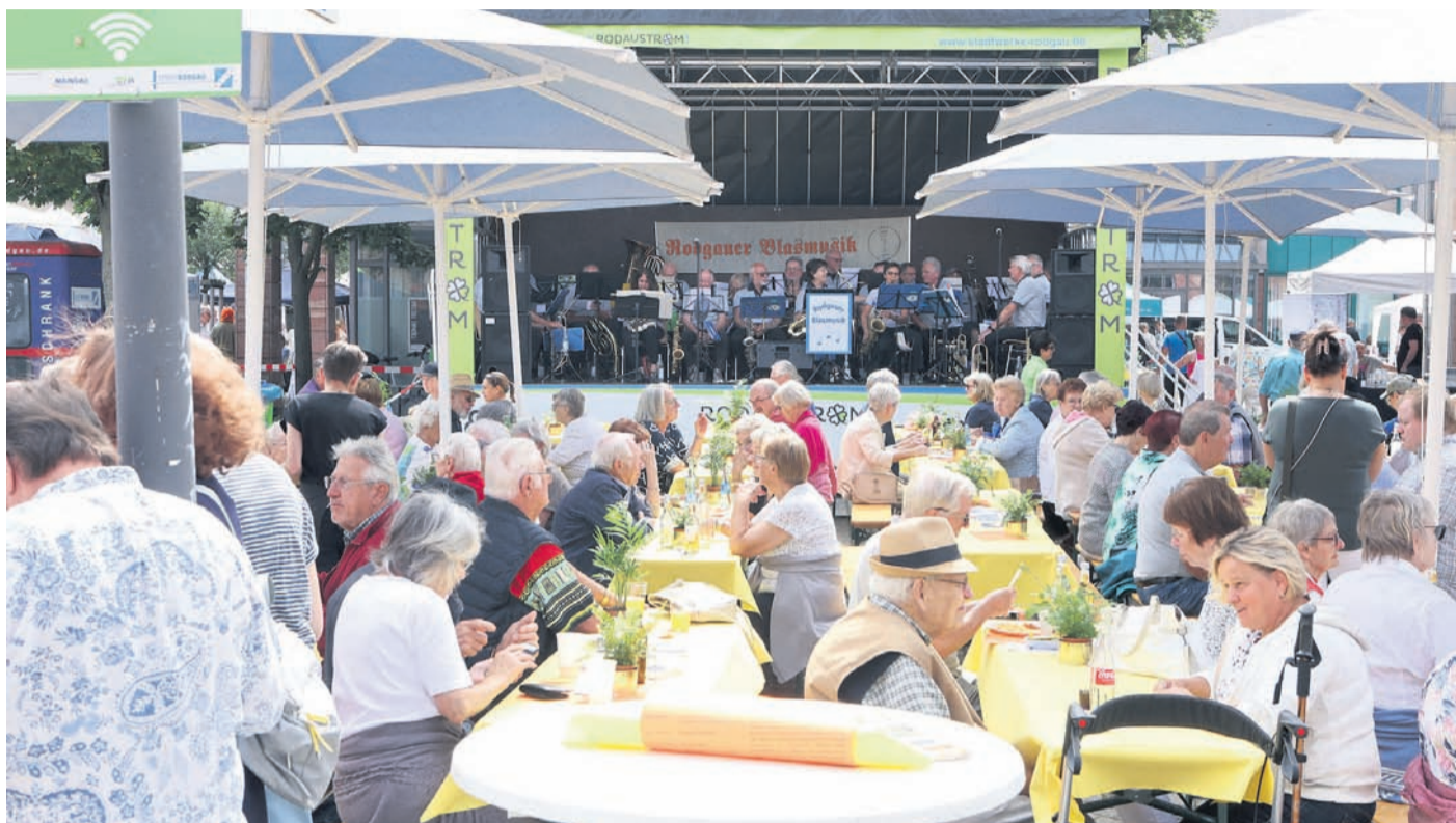
Die Tische zwischen Rathaus und Kirche waren gut besucht. Das musikalische Programm gestaltete unter anderem die Rodgauer Blasmusik mit.

14. Seniorentag lockt Besucher aus allen Stadtteilen vors Rathaus