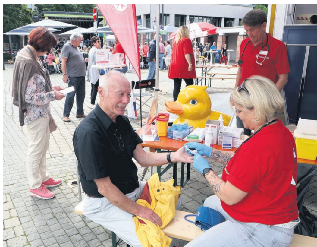
Zahlreiche Infostände bereicherten den Seniorentag.