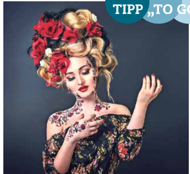
ZAITSA aus der Ukraine ist am Sonntag im Programm.