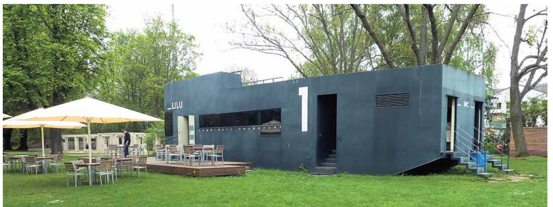
Das in einem hochwassersicheren Ponton eingerichtete Café LILU.

Am Rande des Frankfurter Stadtwaldes und der Sachsenhausener Grenze erstreckt sich der Carl-von-Weinberg-Park. Dieser bewaldete Park bietet einen großzügigen Kinderspielplatz und separate Bereiche für Kinder und Erwachsene zur Erholung. Bitte beachten Sie, dass Hunde im Spielbereich nicht gestattet sind, jedoch in der Nähe auf der Freilauffläche Waldfriedstraße herumtollen können. Eine perfekte Balance zwischen Natur und urbaner Lebensqualität.