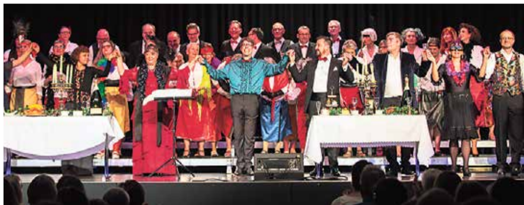
Der Frauenchor lädt zur „Woche der offenen Chöre“ ein.

Chorgemeinschaft Frankfurt nimmt an „Woche der offenen Chöre“ teil