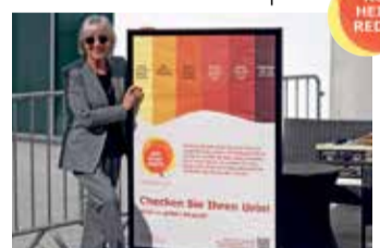
Schauspielerin Heidelinde Weis engagiert sich für Aufklärung.

Mehr Info: www.rotheistreden.de Hotline: 08 00/7 24 36 22