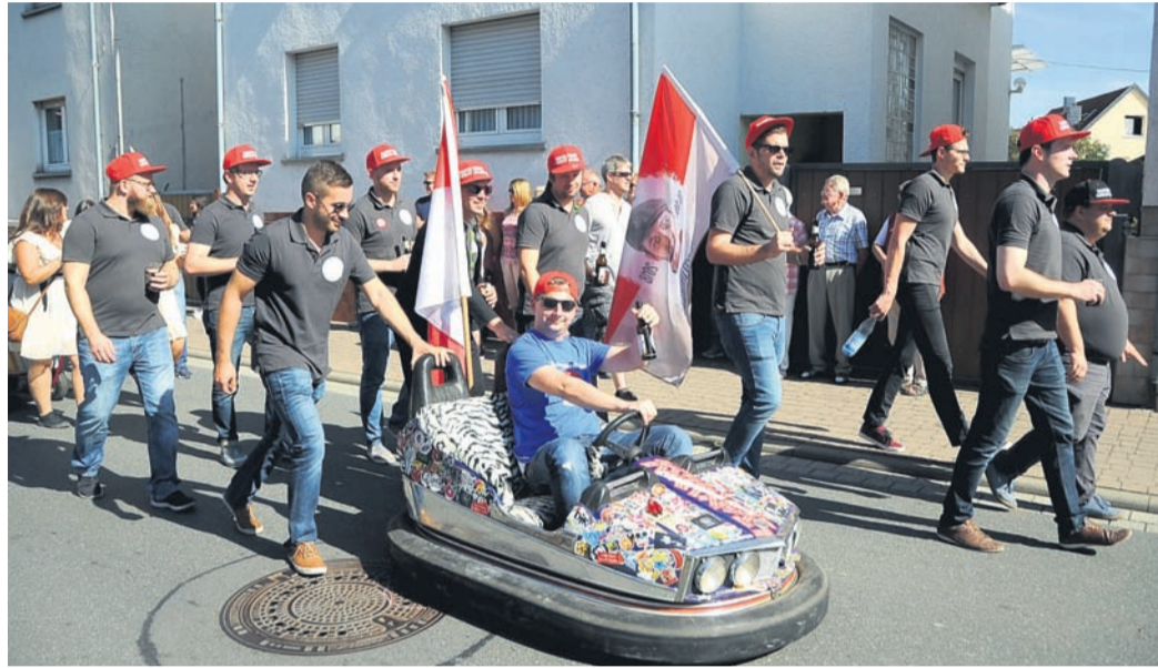
Der Umzug am Sonntagnachmittag wird erneut einer der Höhepunkte der Münsterer Kerb sein. Sie steigt vom 15. bis 17. September - diesmal wieder mit Festzelt und Band.