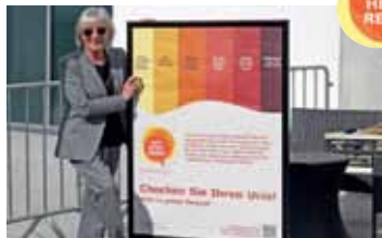
Schauspielerin Heidelinde Weis engagiert sich für Aufklärung.

Mehr Info: www.rotheisstreden.de Hotline: 08 00/7 24 36 22