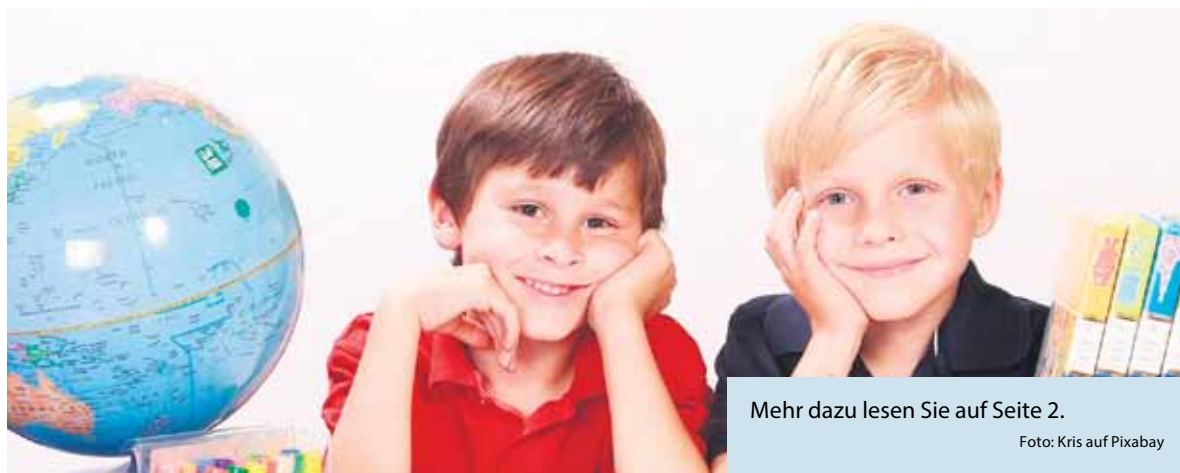
Mehr dazu lesen Sie auf Seite 2.