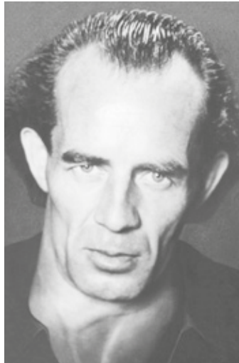
Bruno Gröning (1906–1959)

„Das Phänomen Bruno Gröning“ – 20 Jahre weltweite Präsenz