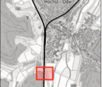
Die Gebiete, in denen gebaut wird.