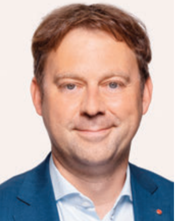
Dr. Jens Zimmermann.

Groß-Umstadt/Berlin. Der Odenwälder Bundestagsabgeordnete Jens Zimmermann (SPD) lädt medieninteressierte Jugendliche zwischen 16 und 20 Jahren nach Berlin ein. Vom 16. bis 20. Oktober veranstaltet der Deutsche Bundestag zum achtzehnten Mal den Jugendmedienworkshop. Ein digitales Vorbereitungswochenende wird vom 16. bis 17. September stattfinden. Der Jugendmedienworkshop ist ein Kooperationsprojekt des Deutschen Bundestages mit der Bundeszentrale für politische Bildung und der Jugendpresse e.V. Insgesamt erhalten 25 politik- und medieninteressierte Jugendliche mit verschiedenen Vorerfah-