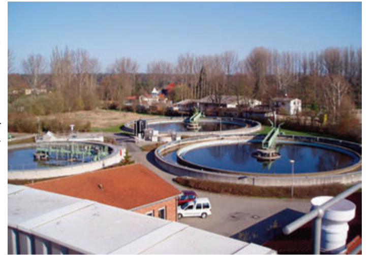
Auch die Dieburger Kläranlage wird bei den Tagen der Industriekultur von Interesse sein, denn das Thema „Wasser“ steht im Mittelpunkt.

Dieburg. Das Thema Wasser steht im Mittelpunkt der „Tage der Industriekultur Rhein-Main 2023“, die vom 29. August bis 3. September im ganzen Rhein-Main-Gebiet angeboten werden.