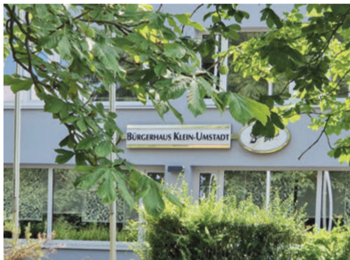
Die Zukunft der Gaststätte ist ungewiss.

„Wir prüfen aktuell alle Möglichkeiten“, sagt Bürgermeister