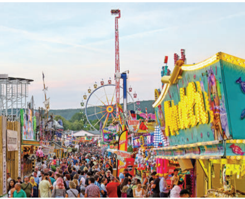
Nach oben katapultiert – auf dem Wiesenmarkt gibt es dieses Jahr gleich zwei Fahrgeschäfte nach ganz oben.

Der Darmstädter ist in Ausbildung zum Wirtschaftsingenieur, konnte aber seiner Leidenschaft in der Corona-Zeit inten-