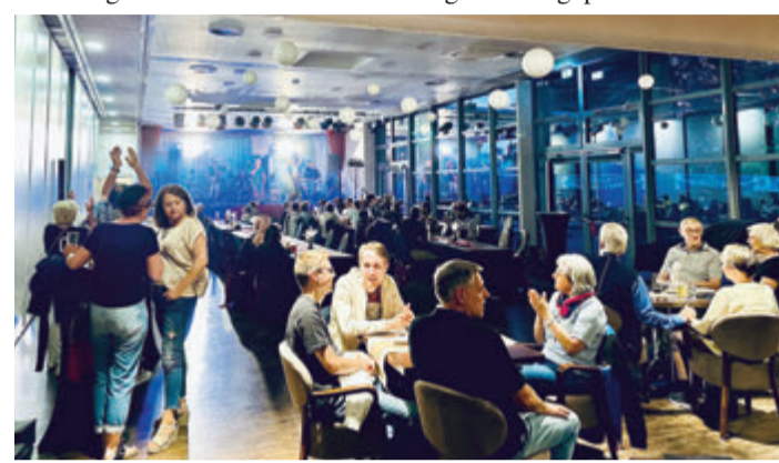
Die Wandelhalle erlebt eine Neueröffnung.

Die Band „Freetime“ sorgte für die musikalische Untermalung des Ereignisses, Cocktails und Snacks wurden gereicht.