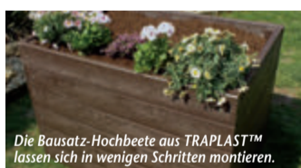
Die Bausatz-Hochbeete aus TRAPLAST™ lassen sich in wenigen Schritten montieren.