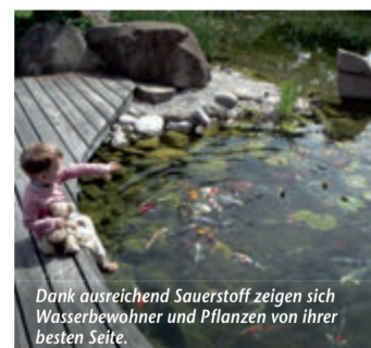
Dank ausreichend Sauerstoff zeigen sich Wasserbewohner und Pflanzen von ihrer besten Seite.

(epr) Sommer, Sonne, Algenzeit – für Teichbesitzer bringen die warmen Monate eine besondere Herausforderung mit sich. Denn durch freigesetzte Nährstoffe und die verlängerte Sonneneinstrahlung vermehren sich verschiedene Algenarten explosionsartig. Für einen ungetrübten Blick auf fidele Fische empfiehlt sich ein zuverlässiges System, das ein optimales biologisches Gleichgewicht im Wasser schafft. Im Vergleich zu herkömmlichen Belüftungsanlagen