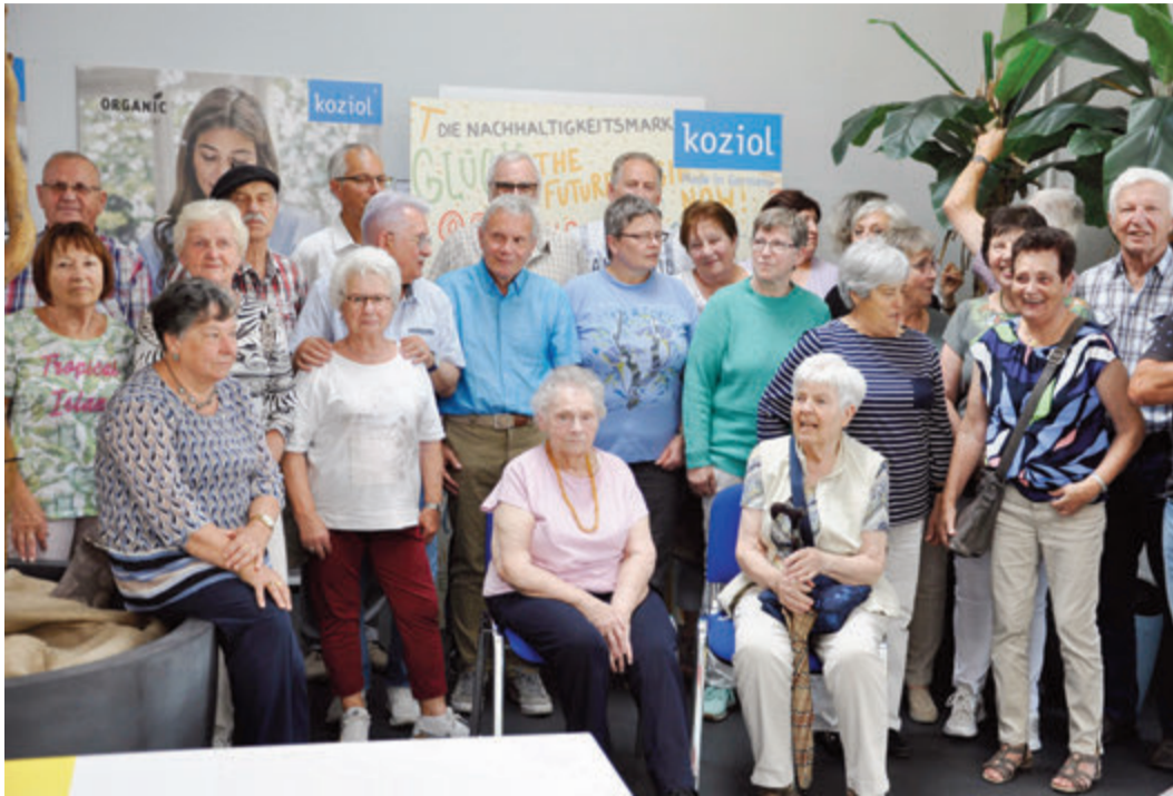
Wiedersehen mit dem ehemaligen Arbeitgeber und Kollegen: Senioren bei Koziol.