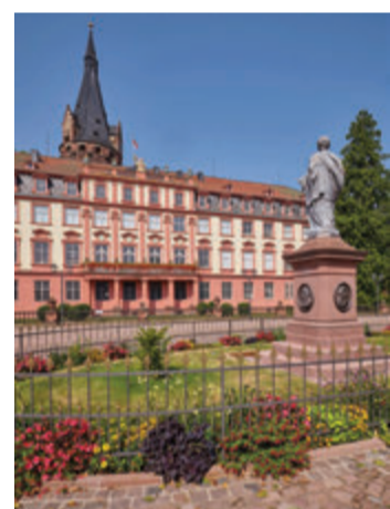
Schloss Erbach im Odenwald.

Weitere Informationen gibt es im Internet unter https://www.schloesser-hessen.de/de/schloss-erbach. red