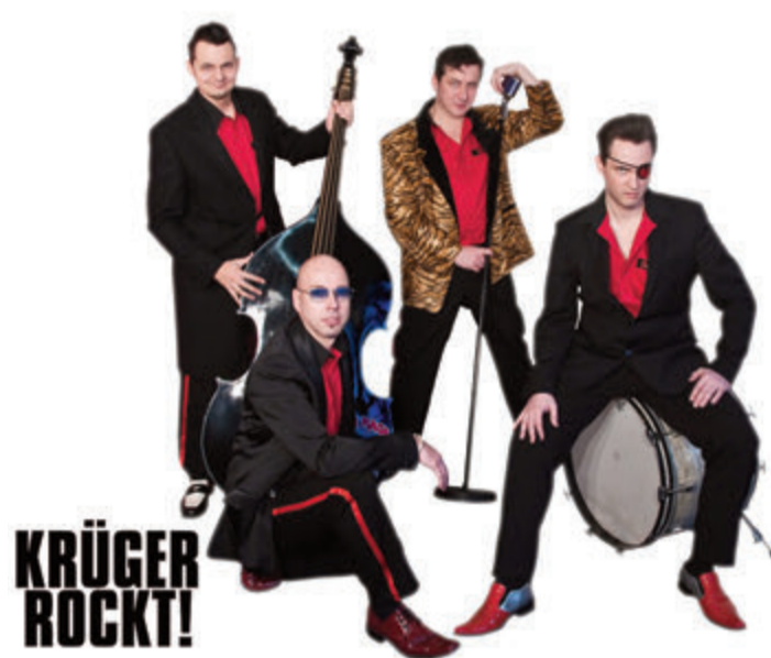
Die deutschlandweit tourende Rock'n'Roll-Band „Krüger rockt!“ kommt auf Einladung vom Verein „Generation Oberzent e.V.“ am 28. Oktober nach Beerfelden.

Die Halle wird um 18 Uhr geöffnet, Karten können ab sofort im Vorverkauf zum Preis von 20