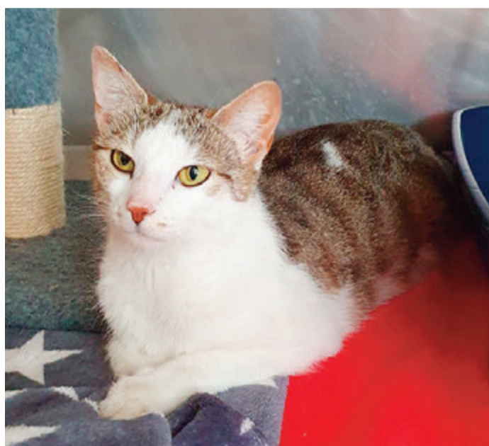
Diese Katze wurde an einer Kreisstraße gefunden.