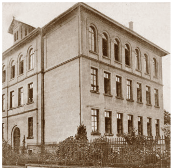
Das Gymnasium Michelstadt auf einer Postkarte von 1908.

Der Eintritt zum Vortrag kostet drei Euro und wird an der Abendkasse im Rathaus bezahlt. red