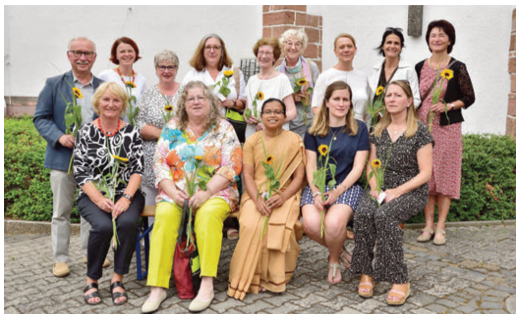
Die neuen Hospizhelfer auf einem Bild.

Groß-Zimmern. 14 neue Hospizhelferinnen und -helfer wurden bei einem Gottesdienst am Samstag, 15. Juli, in der katholischen Kirche St. Bartholomäus in Groß-Zimmern in ihren Dienst entsandt. Sie