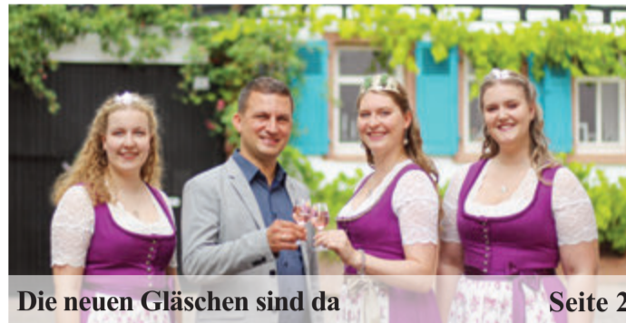
Die neuen Gläschen sind da