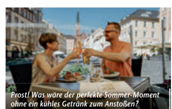
Prost! Was wäre der perfekte Sommer-Moment ohne ein kühles Getränk zum Anstoßen?

(epr) Was braucht es für den perfekten Sommer-Moment? Das Altenburger Land hat die Antwort: eine über 1.000-jährige Geschichte, gastfreundliche Einheimische und regionale Köstlichkeiten! Wer die Region in Thüringen besucht, wird schnell merken: Heimatnähe und gelebte Tradition stehen hier an der Tagesordnung. Wer bspw. an einer öffentlichen Stadtführung teilnimmt, wird nicht nur mit Infos und Geschichten „gefüttert“, sondern darf sich auch an der Verkostung schmackhafter Altenburger Spezialitäten erfreuen. Und ist der Hunger am Ende des Tages noch nicht gestillt, lohnt der Abstecher in eines der ausgezeichneten Restaurants und Gasthäuser. Hier probiert man sich bei gemütlicher Atmosphäre durch saisonale Sommermenüs sowie natürlich durch herzhafte Klassiker der lokalen Küche: Frisch gezapftes Bier, würzige Scheiben Graubrot, eine deftige Portion Sauerkraut und dazu ein saftiges Stück Original Schmöllner Mutzbraten – mmh, so lecker schmeckt das Altenburger Land! Einen Überblick über alles Sehenswerte, Veranstaltungen sowie kulinarische Angebote finden Interessierte unter www.reiseplaza.de/altenburg