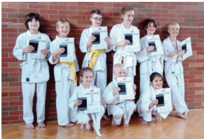
Die Prüflinge von Weiß- bis Orangegurt.