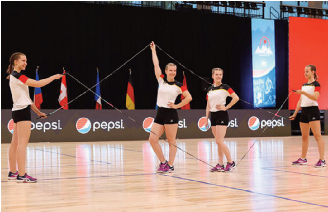
Weitergekommen, als man sich zu erträumen wagte: Die Jumping Gums.