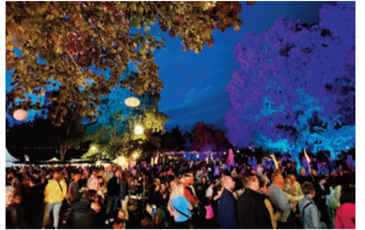
So soll es auch beim FesDival im Dieburger Schlossgarten aussehen: festlich illuminiert, stimmungsvoll und gemütlich.