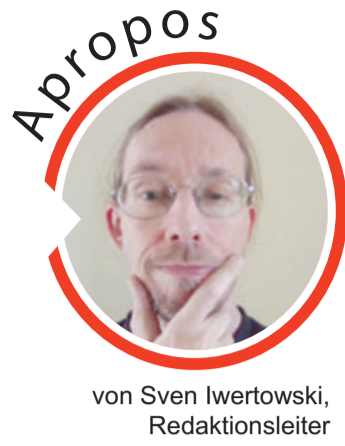
von Sven Iwertowski, Redaktionsleiter