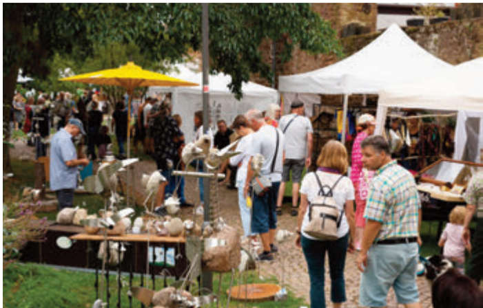
Besucher des Kunsthandwerkermarktes können sich überraschen lassen.

Michelstadt. Zum 12. Mal lädt der Verein der Odenwälder Kunstschaffenden zu seinem Kunsthandwerkermarkt von Freitag, 25., bis Sonntag, 27. August, ein. Im Ambiente des Stadtgartens in der Altstadt reicht das Angebot von unverwechselbarem Schmuck