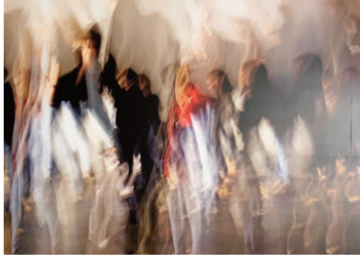
Eine der über 50 Fotografien, die zu sehen sein werden.

Bad König. Die Fotografien des Breuberger Künstler-Ehepaars Barbara und Dietmar Keitzl sind noch bis Ende August in der Rathausgalerie in Bad König zu sehen. Bei der Ausstellung werden