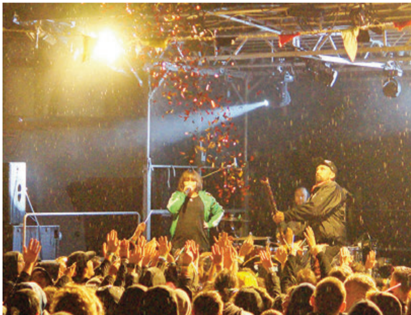
Stimmung wie in den vergangenen Jahren soll es auch dieses Mal geben: Im Bild ein Auftritt von „Grossstadtgeflüster“ auf einem vorigen Nonstock.