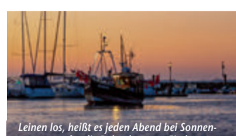
Leinen los, heißt es jeden Abend bei Sonnenuntergang für die Boltenhagener Fischer.

(epr) Eine leichte Brise, Salz in der Luft und rauschende Wellen: Das Meer weckt ein einzigartiges Lebensgefühl. Wer dieses schmerzlich vermisst und den nächsten Strandurlaub kaum erwarten kann, muss längst keinen langen und stressigen Flug mehr antreten. Denn auch an der mecklenburgischen Ostseeküste gibt es feinen, weißen Sandstrand, kristallklares Wasser und etliche Sonnenstunden. Wie wäre es z. B. mit einem Urlaub im Ostseebad Boltenhagen? Hier erwartet die Besucher ein fünf Kilometer langer Strandabschnitt zum Sonnen, Schwimmen, Baden, Tauchen und Seele baumeln lassen. Das Seeheilbad bietet beste Bedingungen für einen Urlaub ganz für sich, zu zweit, mit Freunden oder Kind und Kegel. Unter www.reiseplaza.de/boltenhagen bekommt man alle wichtigen Infos.