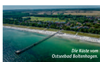
Die Küste vom Ostseebad Boltenhagen.

seit Kurzem ein neues ÖPNV-Tagesticket, das nicht nur im ARBERLAND – dem Landkreis Regen – sowie in den Landkreisen Freyung-Grafenau und Cham gilt, sondern auch in den westlichen Bereichen der Bezirke Pilsen und Südböhmen. Für 17 Euro pro Person und Tag sind damit auch Fahrten ins benachbarte Tschechien möglich, insgesamt können über 400 Verkehrsverbindungen genutzt werden. Und das Beste: Touristinnen und Touristen mit dem kostenlosen Gästeservice Umwelt-Ticket, kurz GUTI, fahren gratis! Der Geltungsbereich des Tickets wurde erweitert und entspricht nun dem Bayerwald-Tagesticket+CZ. Die GUTI-Gästekarte gilt vom Anreis bis zum Abreisetag und ermöglicht einen nachhaltigen und verantwortungsbewussten Urlaub. Mehr unter www.reiseplaza.de/arberland