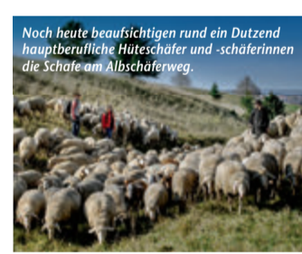
Noch heute beaufsichtigen rund ein Dutzend hauptberufliche Hüteschäfer und -schäferinnen die Schafe am Albschäferweg.

Bregenzer Hafen und Lochau entlangfahren bzw. -flanieren. Hier warten nicht nur ein separater Fahrrad- und Fußgängerweg; auch der Uferbereich wurde in einen einladenden Strandabschnitt mit eigenem Badesteg verwandelt. In der weitgehend autofreien Innenstadt bummeln Besucher in der größten Fußgänger- und Begegnungszone Vorarlbergs nach Herzenslust durch Modehäuser, Boutiquen und Concept Stores oder lassen sich kulinarische Köstlichkeiten in den zahlreichen Cafés, Bars und Backstuben auf der Zunge zergehen. Sommerlicher Hochgenuss sind die alljährlichen Bregenzer Festspiele, die uns in 2023 mit Giacomo Puccinis Meisterwerk „Madame Butterfly“ in eine magische Welt aus japanisch inspirierten Bühnenbildern, fulminanten Klängen und emotionalen Achterbahnfahrten entführen. Mehr unter www.reiseplaza.de/bregenz