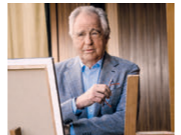
In der Jury: Friedrich von Thun

Gürtelrose wird durch das Varizella-Zoster-Virus ausgelöst, das nach einer Windpocken-Erkrankung im Körper verbleibt. In Deutschland betrifft dies mehr als 95 Prozent der über 60-Jährigen. Wird mit zunehmendem Alter das Immunsystem schwächer, steigt das Risiko für eine Reaktivierung des Virus an. Gürtelrose bricht bei 1 von 3 Menschen im Laufe des Lebens aus.