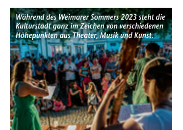
Während des Weimarer Sommers 2023 steht die Kulturstadt ganz im Zeichen von verschiedenen Höhepunkten aus Theater, Musik und Kunst.

(epr) Wo der historische Charme der Kulturstadt Weimar auf zeitgenössische Höhepunkte aus Theater, Musik und Kunst trifft, warten ganz besondere Genussmomente auf Besucherinnen und Besucher. Mit idyllischen Parkanlagen, großzügigen Plätzen und lauschigen Gassen bildet die Klassikerstadt die perfekte Kulisse für Theaterexperimente, Performances, Straßenfeste und Konzerte. Im Rahmen des Weimarer Sommers trumpft von Juni bis September die internationale Kulturszene mit spannenden Inszenierungen und Auftritten auf. So laden verschiedene Open-Air-Konzerte auf der Seebühne zu exquisiten Konzerten unter freiem Himmel ein. Allen Bauhaus-Fans seien die Feierlichkeiten rund um den 100. Jahrestag der ersten großen Bauhaus-Ausstellung empfohlen, die 1923 mit dem ersten Experimentalbau, dem Haus Am Horn, für Furor sorgte. Mit Ausstellungen, Festwochen und einer Bauhaus-Parade im August zollt Weimar diesem Aufbruch in ein neues Zeitalter des Designs und Bauens gebührenden Tribut. Alle Informationen unter www.weimarer-sommer.de