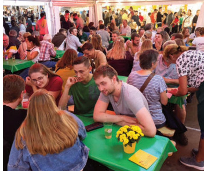
Zeit, um Freunde zu treffen.

Weitere Informationen wie Fahrpläne der Fähre und Busse, Öffnungszeiten, Interessantes aus den früheren Jahren des Eberbacher Kuckucksmarkts und das aktuelle Programm unter: www.eberbacher-kuckucksmarkt.de