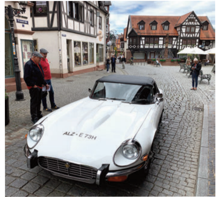
Schöne alte Autos sind nur ein Teil des Nostalgie-Wochenendes.

Michelstadt. Die 70er Jahre werden für ein Wochenende in Michelstadt vom Gewerbeverein wiederbelebt: Am Samstag, 2. September und Sonntag, 3. September stehen die 70er und 80er Jahre im Mittelpunkt. Am Samstag gibt ab 20 Uhr die Band „Hot Stuff“ ein Open-Air-Konzert im Kellereihof. Einlass ist ab 19 Uhr. Karten gibt es online www.kulturforum-odenwald.de und zum etwas höheren Preis an der Abendkasse. Am Sonntag, 3. September steigt das Oldtimerfestival von 11-18 Uhr. Modelle aus den 60er, 70er und 80er Jahren rollen durch die Innenstadt, werden am historischen Rathaus vorgestellt und anschließend in der Innenstadt geparkt. Zudem ist der Sonntag verkaufsoffen, die Gastronomiebetriebe bieten zum Thema passende Speisen und Getränke an. red