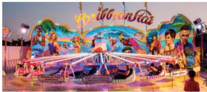
Bunt und fröhlich auf dem Michelmarkt Seite 7