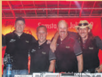
Red-Stone DJ Team