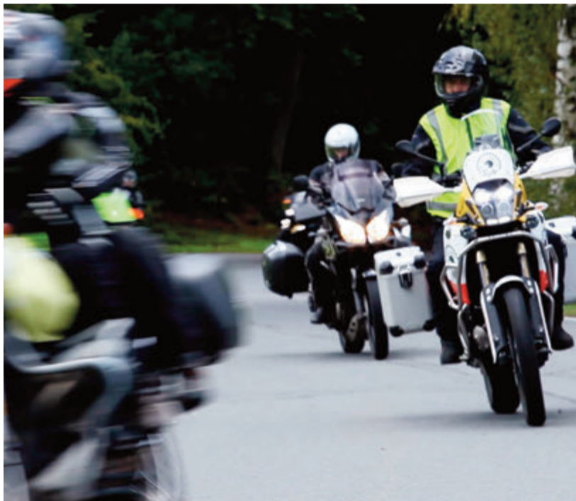
Die Demonstrationsfahrt durch den Odenwald im letzten Jahr. Los geht es auf dem Pferdemarktgelände am 26. August, wo die Tour auch endet.

Auch das überregionale Spendenprojekt „Auf und Ab“ soll bedacht werden. Bei diesem Projekt steht eine Graphic Novel im Mittelpunkt, bei der Depressionen und Angststörungen bei Jugendlichen entgegengewirkt werden soll. Ziel der Fahrten ist es, Aufmerksamkeit für das Thema Depression zu schaffen. Die Schwerpunkte, die die Initiative setzen möchte, sind zum einen die Verbesserung der Zugänglichkeit zu