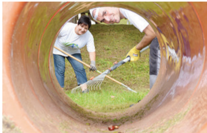
Hier wird gearbeitet, bis der Spielplatz sauber ist.

Odenwaldkreis. Zum zehnten Mal findet am Samstag, 9. September, von 10 bis 16 Uhr der erste von zwei Freiwilligentagen statt. Der zweite folgt am 16. September. Dies sind nur einige Beispiele von vergangenen Aktionstagen, die die Ehrenamtsagentur des Odenwaldkreises schon begleitet hat. Noch bis kurz vor den Terminen können sich sowohl engagierte Freiwillige für bereits veröffentlichte Projekte als auch Vereine und Organisationen mit einem eigenen Projekt anmelden. Bei Rückfragen steht die Ehrenamtsagentur des Odenwaldkreises unter der Telefonnummer 06062 70-127 oder per E-Mail an engagiert@odenwaldkreis.de zur Verfügung. Anmeldungen von Projekten unter: www.freiwillig-im-odenwaldkreis.de . red