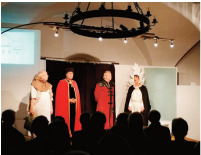
Die Theateraufführung im letzten Jahr.

Eine Karte kostet im Vorverkauf 16 Euro bei der Gästeinformation Michelstadt, Marktplatz 1. Tel.: 06061-74610, E-Mail: touristik@michelstadt.de. red