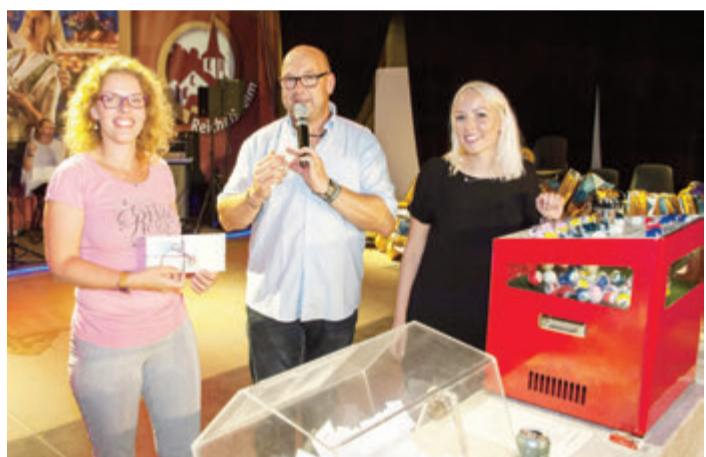
Bald heißt es wieder "Bingo!".

Reichelsheim. Der Gewerbeverein auf seinem Spielfeld hat. Die Gewinnzahlen werden aus einer Lotstrommel gezogen. Nach dem Festzelt die englische Art des „Bingo-Ruf“ und der Kontrolle mit Preisvergabe beginnt ein „Bingo!“ ruft laut hinaus, wer als erster sechs Zahlen in einer Reihe steht ein Gewinner fest. red