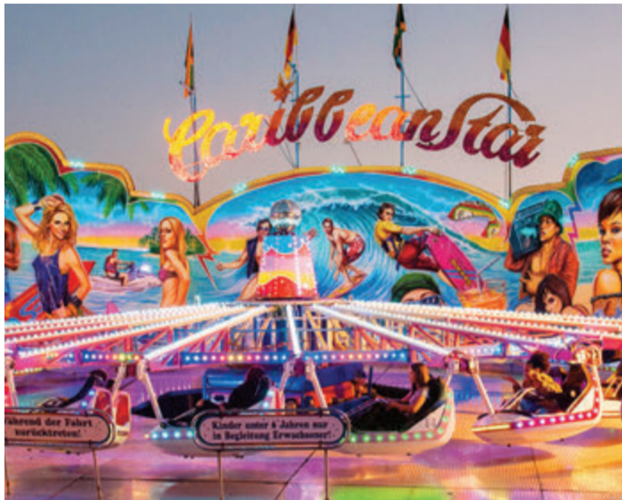
Noch bis einschließlich Montag geht es auf dem Michelsmarkt rund.

chelsheim. Die Partyband Mo-Abend, bevor es zur Auslosung Gigs verschönert ab 19 Uhr den der „Montagsgewinner“ geht. red