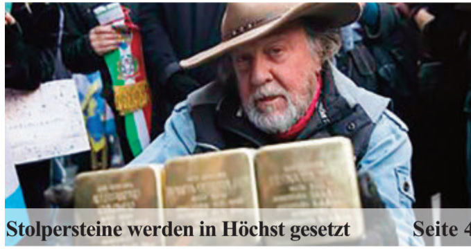
Stolpersteine werden in Höchst gesetzt