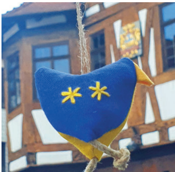
Das Michelstadt-Huhn vor dem historischen Michelstädter Rathaus.

Michelstadt-Huhn samt EIdentity-Card für acht Euro in der Touristik-Info erhältlich. red