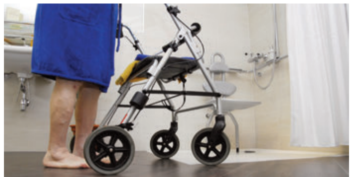
Enge Wohnungen können den Weg mit dem Rollator erschweren.

Landkreis Darmstadt-Dieburg/Odenwaldkreis. Die Industriegewerkschaft Bauen-Agrar-Umwelt (IG BAU) warnt vor einem Mangel an Seniorenwohnungen.