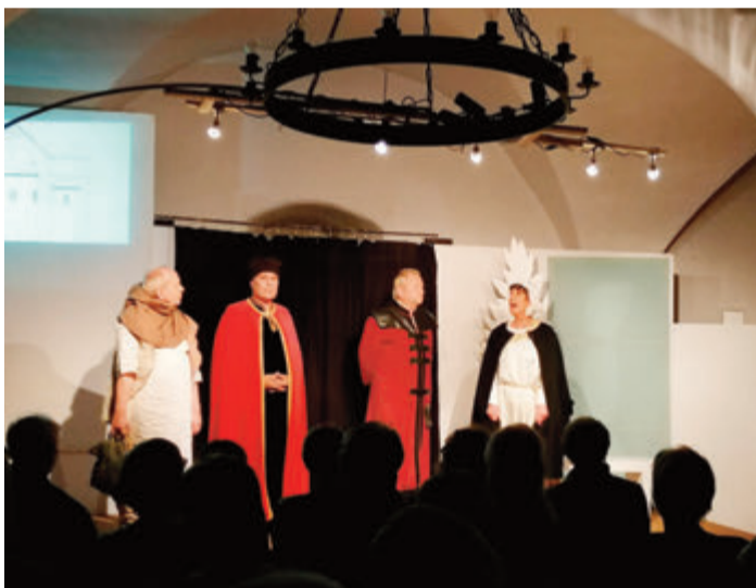
Die Theateraufführung im letzten Jahr.

Michelstadt. Am zweiten und dritten Septemberwochenende, am 9./10. und 16./17. September, wird ein Theaterstück über das Leben