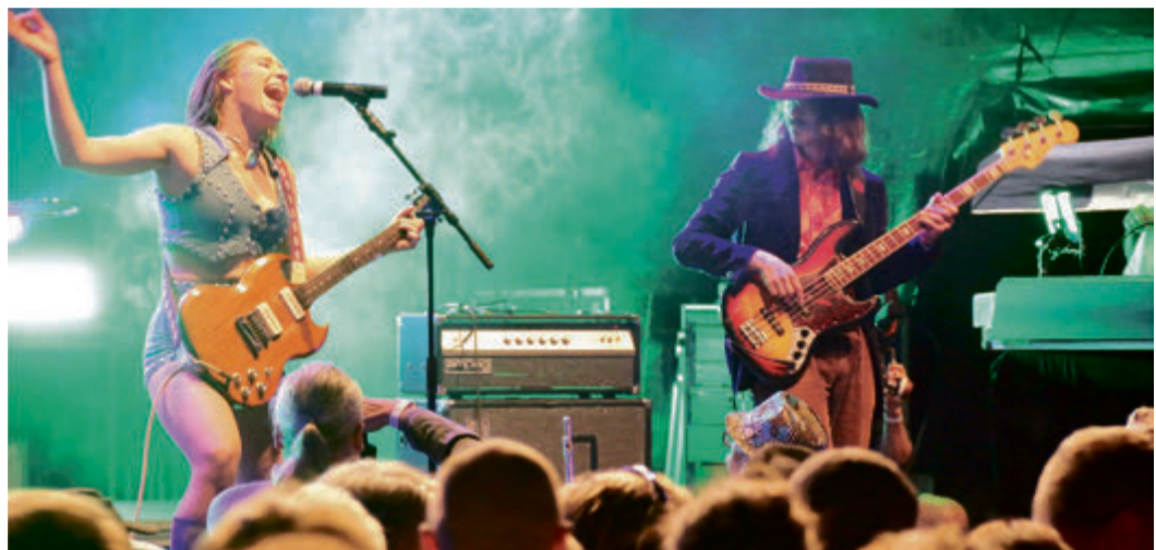
Wucan rockt die Bühne.