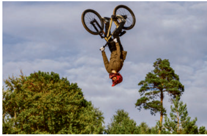
Verschiedenste Tricks und Rennen gibt es auf dem 4 Bikes-Festival zu sehen. Hier gibt es einen Salto.

Lützelbach. Das 4 Bikes-Festival geht in die dritte Runde und bringt erneut Fahrrad-Begeisterte und die, die es werden wollen, in den Odenwald. Vom Donnerstag, 7. September, bis Sonntag, 10. September, verwandelt sich das stillgelegte Militärgelände inmitten des Lützelbacher Walds in einen Fahrrad-Spielplatz, auf dem Radsport, Musik und Entertainment an vier Tagen zu einem Festival verschmelzen.