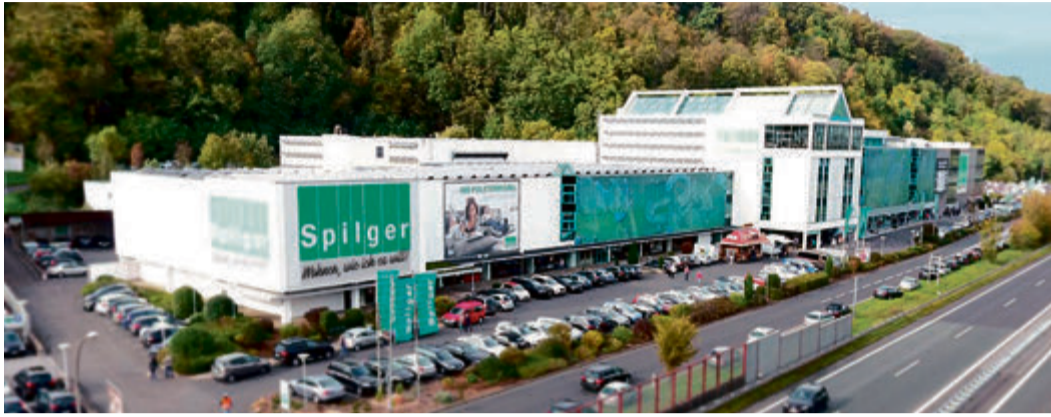
Möbelhaus Spilger in Obernburg