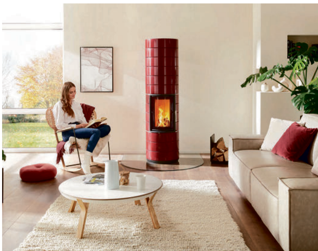
Ein Kaminofen mit massiver Speichermasse bringt Feuer und Wärmebedarf in Einklang.