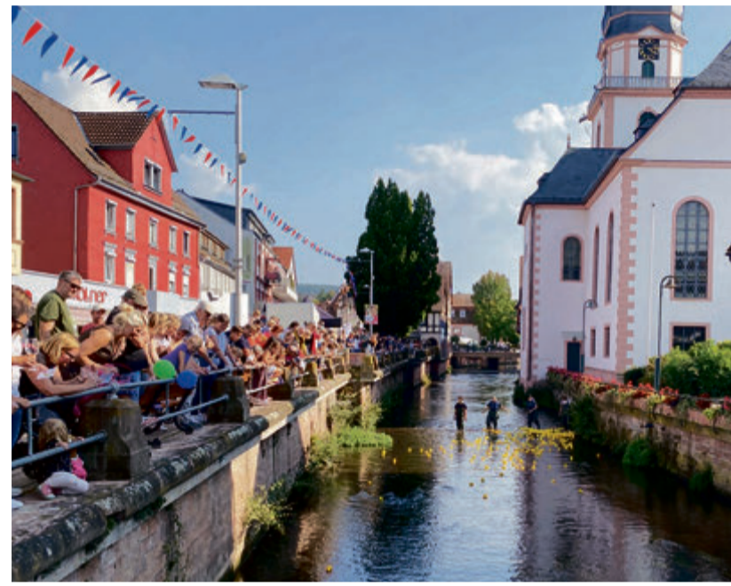
Und los geht's! Viele kleine gelbe Quetscheentchen machen sich auf den Weg beim Entenrennen.

Erbach. In Erbach geht es am kommenden Wochenende hoch her: Die Kreisstadt feiert nicht nur ihr 153-jähriges Städtepartnerschaftsjubiläum mit vier Partnerstädten mit dem Fest der Freundschaft, sondern auch den Schlossmarkt, den Antiktag, Kerwemarkt und einen verkaufsoffenen Sonntag. Aber der Reihe nach: Die vier Partnerstädte Pont-de-Beauvoisin (60 Jahre), Königsee (32 Jahre), Ansião (31 Jahre) und Jicin (30 Jahre) schicken Delegationen zu einem Treffen unter Freunden vorbei. Höhepunkt ist am Samstag, 9. September, das Fest der Freundschaft auf dem Erbacher Marktplatz. Den Start der Feierlichkeiten markiert die offizielle Einweihung des Platzes der Freundschaft, der in den vergangenen Wochen verschönert und mit den Wappen der Partnerstädte ausgestattet wurde. Im Anschluss beginnt das große Fest auf dem Marktplatz. Zudem haben die Stände der Marktbesucher von 15-20 Uhr geöffnet, denn an diesem Tag ist auch der monatliche Erbacher Schlossmarkt. Neben Marktständen mit regionalen Produkten gibt es ein reichhaltiges Angebot an Kunsthandwerk. Der Genussmarkt wird von einem