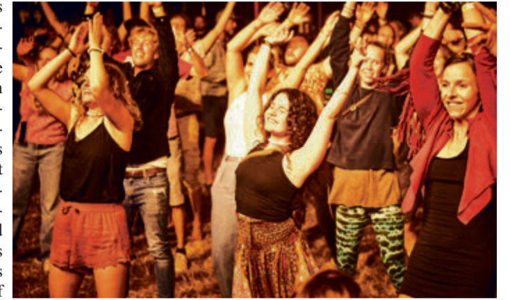
Super Stimmung bei den Musikacts.

rad-Enthusiasten, vom Hobby-Biker bis zum UCI-Athleten. Für alle, die ihren aktiven Part eher am Streckenrand und vor der Bühne sehen, gibt es rund um die Uhr mehr als genug zu erleben. Angefangen bei spannender Rennaction von früh bis spät in vier Disziplinen über interessante Show und Vorträge bis hin zum ausgewählten Musikprogramm mit bekannten Künstlern und aufstrebenden Newcomern. In allen Bereichen des Festivals konnten die Macher zusammen mit Experten aus den einzelnen Bikesparten ein ganz besonderes Event kreieren. Als besonderes Highlight werden zwei Bereiche in diesem Jahr auf ein neues Level gehoben: Zum einen wird bei den Dirt Jumps mit dem neuen Partner Schanzwerk frischer Wind in die Freeride Mountain Bike (FMB) World Tour gebracht. Dabei wird nicht nur an die Top-Athleten der Dirt-Szene gedacht, sondern erstmalig auch an den Amateurbereich und die Kids. Zum anderen haben sich die Odenwälder Veranstalter entschieden, in der Enduro Sparte zukünftig mit Chili Motion zusammenzuarbeiten. Das 4 Bikes Festival bringt nicht nur eine europäische Endurorennserie in den Odenwald, der Stopp in Lützelbach ist sogar das Finale der gesamten Serie. red