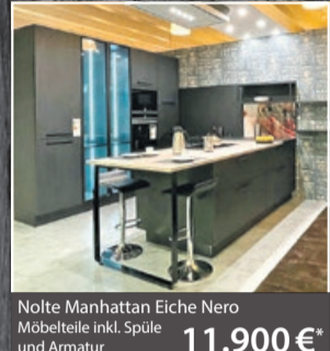
Nolte Manhattan Eiche Nero Möbelteile inkl. Spüle und Armatur 11.900 €