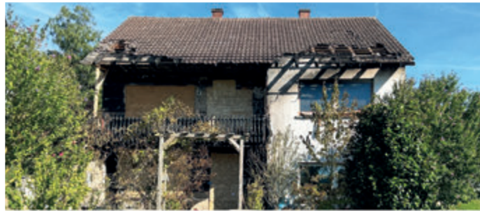
Verletzte bei Wohnhausbrand