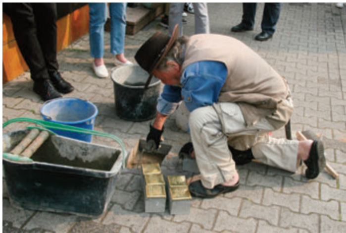
Künstler Gunter Demnig bei der Verlegung von sechs Stolpersteinen in der Schwanenstraße.