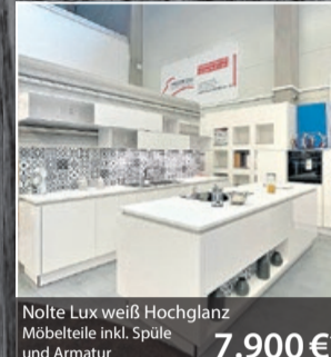
Nolte Lux weiß Hochglanz Möbelteile inkl. Spüle und Armatur 7.900 €