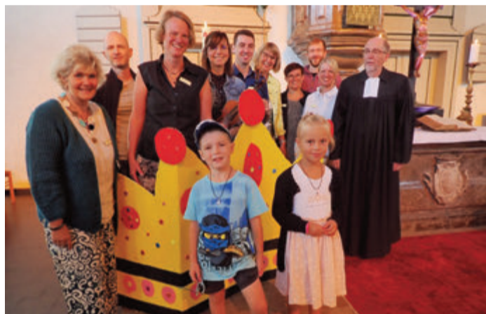
Kinder mit Eltern und Krone vor dem Altar.

„Lasset die Kinder zu mir kommen“ stand auf dem farbigen und ansprechenden Liederblatt, welches eigens für diesen Gottesdienst gestaltet und gedruckt worden war. Mit viel Freude sangen, klatschten,