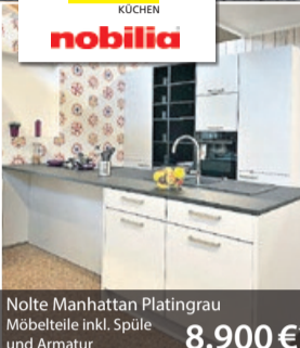
Nolte Manhattan Platingrau Möbelteile inkl. Spüle und Armatur 8.900 €