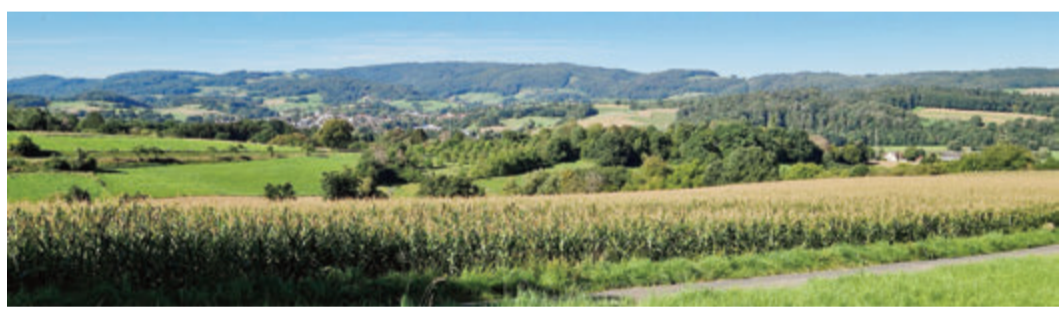
Blick von Affhöllerbach ins Gersprenztal.

Nach kurzer Eröffnungsansprache startet von hier aus die Wanderung, deren Gesamtstrecke am Eröffnungstag geführt angeboten wird. Die gesamte Strecke incl. zweier Abkürzungen ist gut markiert, so dass alle Wegevarianten auch ohne Führung begangen werden können. red