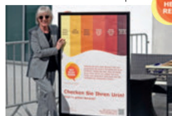
Schauspielerin Heidelinde Weis engagiert sich für Aufklärung.

Mehr Info: www.rotheisstreden.de Hotline: 08 00/7 24 36 22