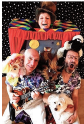
Tolle Töne aus der Tüte.