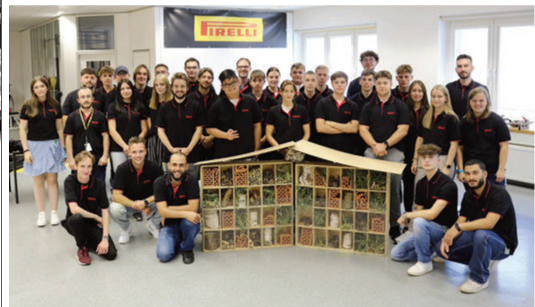
Auszubildende haben ihre Berufsausbildung bei Pirelli Deutschland begonnen. Bei der Einführungsveranstaltung starteten sie das Projekt "Insektenhotels bei Pirelli".

Breuberg, 7. September 2023 – Pirelli Deutschland, bei der Begrüßung der Nachwuchskräfte. Ein neues Kapitel ihres Lebens begann am 11. September für 35 ambitionierte junge Menschen: Bei Pirelli Deutschland in Breuberg traten sie ihre Ausbildung an. Die Gruppe besteht aus neun Frauen und 26 Männern, die sich auf insgesamt acht unterschiedliche Ausbildungsberufe und sechs duale Studiengänge aufteilen – sowohl im technischen als auch im kaufmännischen Bereich. Diese Vielfalt unterstreicht das breite Spektrum an Karrieremöglichkeiten, das Pirelli seinen Nachwuchskräften bietet. „Der Beginn Ihrer beruflichen Laufbahn ist ein bedeutender Meilenstein“, betonte Thomas Hofmann, Leiter Personalwesen bei