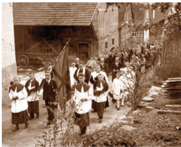
Ein Prozessionszug der katholischen Pfarrkuratie Vielbrunn in der Wilhelm-Leuschner-Straße in Vielbrunn auf dem Weg zur Kapelle am Bremhofer Weg 5. Dieses historische Foto entstand im Jahr 1954.

schließlich auch, der bei Veran-staltungen, Konfirmationen und Kommunionen die Fotos schoss und so zum Dorfchronisten wurde. Wer damals ein Fotoap-parat besaß, konnte sich glück-lich schätzen. Bevor man ein Foto schoss, überlegte man sehr wohl, ob es sich lohnt, den Aus-löser zu drücken. Denn ein Bild, Entwicklung eingerechnet, kos-tete damals etwa ein bis zwei Mark und es war eine Menge Ar-beit damit verbunden. Der Heim- und Touristikverein Vielbrunn präsentiert die zehnte Ausgabe der Vielbrunner Zeitge-schichte in Form eines Jahreska-landers mit alten Fotos. Das Druckwerk beinhaltet neben dem Fotomaterial reichlich Informa-tionen zur Orts- und -Bauge-schichte der gezeigten Anwesen. Mehr Infos unter Telefon 06066-969469 oder per E-Mail an vor-stand@hvt-vielbrunn.de. red