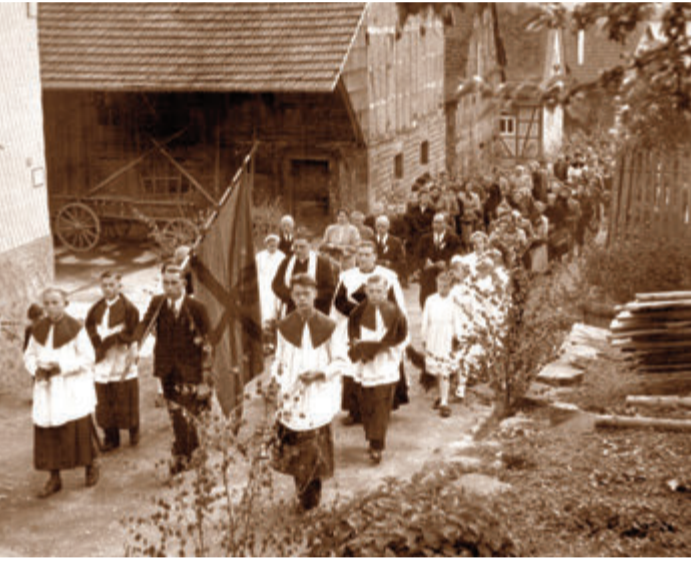
Ein Prozessionszug der katholischen Pfarrkuratie Vielbrunn in der Wilhelm-Leuschner-Straße in Vielbrunn auf dem Weg zur Kapelle am Bremhofer Weg 5. Dieses historische Foto entstand im Jahr 1954.

schließlich auch, der bei Veran-staltungen, Konfirmationen und Kommunionen die Fotos schoss und so zum Dorfchronisten wurde. Wer damals ein Fotoap-parat besaß, konnte sich glück-lich schätzen. Bevor man ein Foto schoss, überlegte man sehr wohl, ob es sich lohnt, den Aus-löser zu drücken. Denn ein Bild, Entwicklung eingerechnet, kos-tete damals etwa ein bis zwei Mark und es war eine Menge Ar-beit damit verbunden. Der Heim- und Touristikverein Vielbrunn präsentiert die zehnte Ausgabe der Vielbrunner Zeitge-schichte in Form eines Jahreska-landers mit alten Fotos. Das Druckwerk beinhaltet neben dem Fotomaterial reichlich Informa-tionen zur Orts- und -Bauge-schichte der gezeigten Anwesen. Mehr Infos unter Telefon 06066-969469 oder per E-Mail an vor-stand@hvt-vielbrunn.de. red