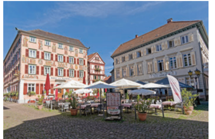
Alter Marktplatz in Eberbach.

dritte Gruppe wandert von den Burgruinen aus am Fuße des Gebirges entlang bis auf 380 m bis 16.9. unter 06071 43755 oder Höhe und geht ebenfalls über den helmut.kriha@freenet.de. red