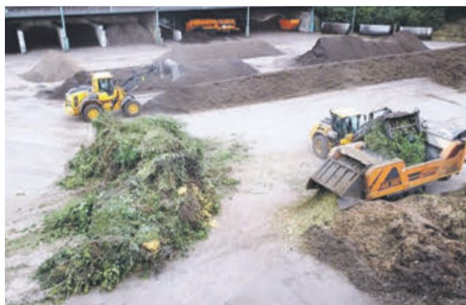
Aus Grünschnitt wird Kompost und Gartenerde. Auch torffreie Gartenerde entsteht so, wie hier beim Kompostwerk in Groß-Umstadt/Semd.

men von regionalen Lieferanten lose Ware zur Selbstabfüllung zu und aus eigener Produktion. einem Preis, der günstiger ist als Torffreie Blumenerde gibt es als handelsübliche Blumenerde.