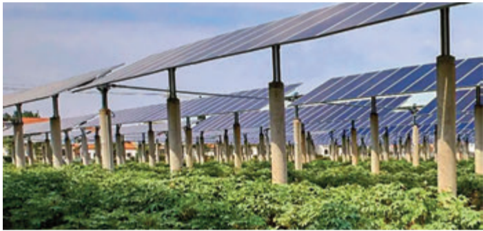
Gemüse unter Solarpanelen

Otzberg. Nahe der Bahnlinie Reinheim-Lengfeld soll das Projekt „Agri-PV“ der Bürgerenergiegesellschaft Otzberg (kurz: BEGO) umgesetzt werden, das Energiegewinnung und Landwirtschaft auf klimafreundliche Weise vereint. Unter und zwischen erhöht installierten Solaranlagen findet der ökologische Anbau von Gemüse durch eine nahegelegene Bio-Gärtnerei statt. Der Schatten der Solarpaneele schützt Pflanzen und Tiere vor starker Hitze und senkt ihren Wasserbedarf, was sich positiv auf den Grundwasserbestand auswirkt. Denn auch die Gemeinde Otzberg ist nicht vom Klimawandel verschont geblieben: Außergewöhnlich trockene Sommer und Extremwetterlagen führten in den letzten Jahren zu Missernten und