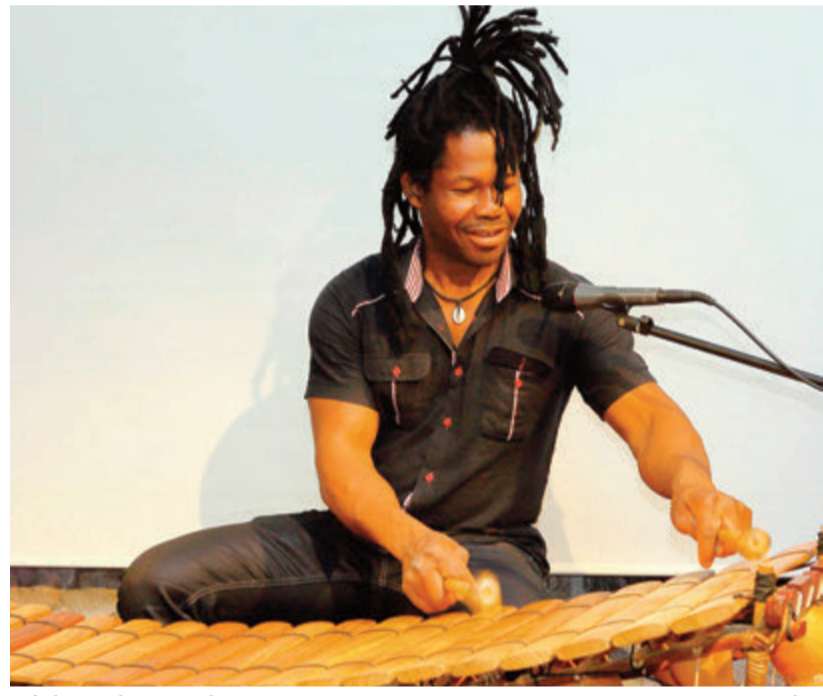
Afrikanischer Musiker.

Die evangelische und katholische Kirchengemeinden Brensbachs feiern an diesem Sonntag, 24. September ihr Erntedankfest unter dem Motto: »Gottes Geschenk der Vielfalt.« Der Festgottesdienst dazu wird ab zehn Uhr ebenfalls in der Kulturhalle des Gemeindezentrums stattfinden. Er wird somit zum Auftakt des Afrikafestes, das anschlie-