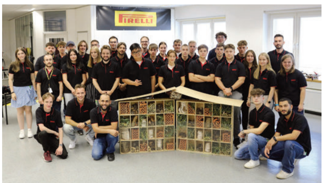
Auszubildende haben ihre Berufsausbildung bei Pirelli Deutschland begonnen. Bei der Einführungsveranstaltung starteten sie das Projekt "Insektenhotels bei Pirelli".