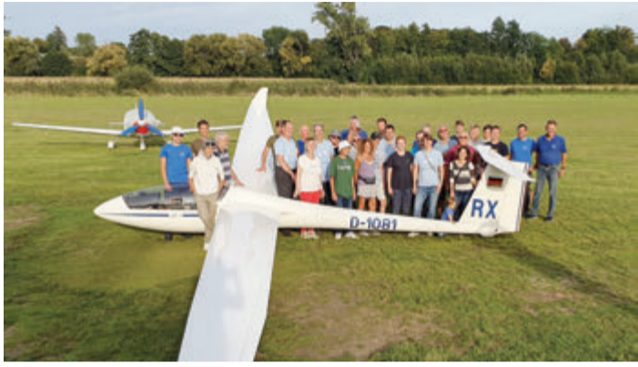
Gemeinsam erfolgreich – viele Mitglieder haben mit ihren Flügeln zum Aufstieg beigetragen

Reinheim. Die Segelflieger der Flugsportvereinigung Reinheim (FSVOR) haben erneut ihr hohes Niveau unter Beweis gestellt und sichern sich auch in der DMSt-Liga einen Aufstiegsplatz. Mit einem vierten Rang in der Abschlussstabelle der Saison 2023 steigen die Reinheimer für das kommende Jahr in die 1. Bundesliga der DMSt (Deutsche Meisterschaft im Streckensegelflug) auf.