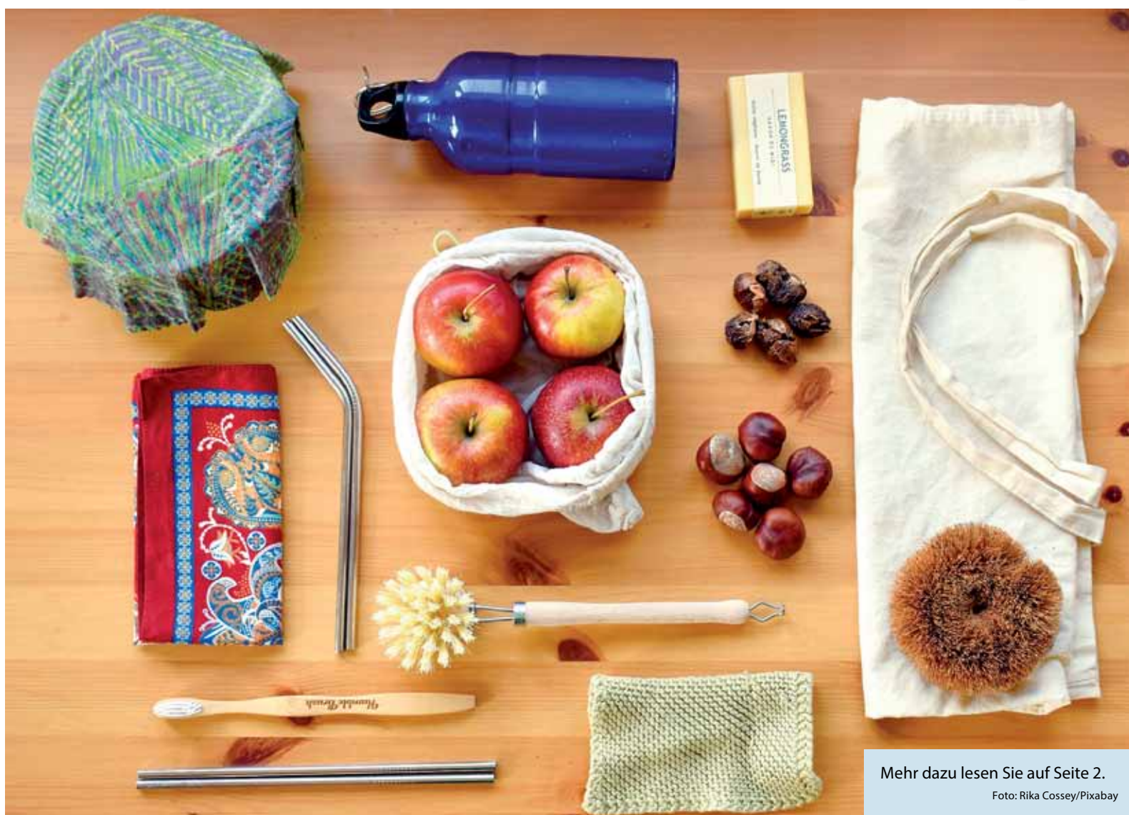
Mehr dazu lesen Sie auf Seite 2.

Nachhaltiger Einkaufen leicht gemacht 10 praktische Tipps für umweltbewusste Verbraucher