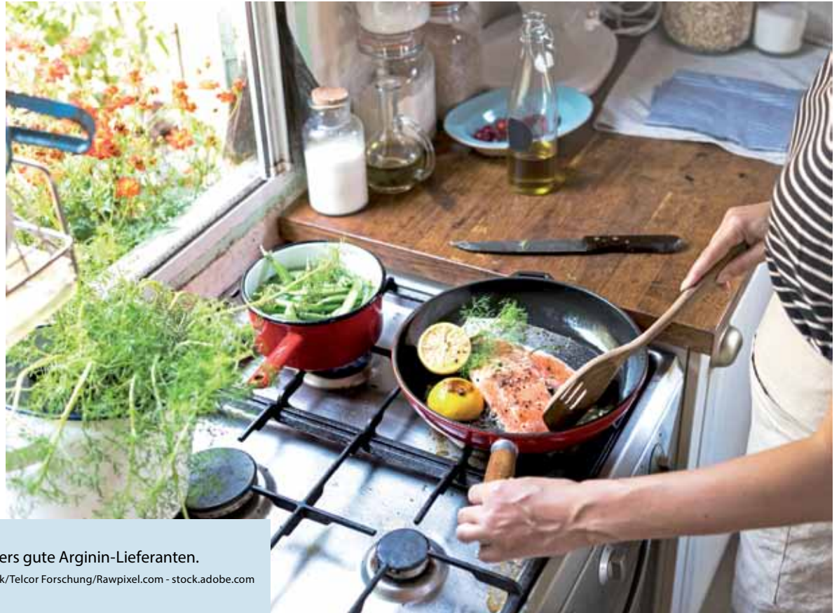
Fisch und Hülsenfrüchte sind besonders gute Arginin-Lieferanten.

(DJD-K). Gesunde Blutgefäße sind ein wichtiger Faktor für ein langes Leben. Werden sie durch Arteriosklerose verengt, kann es zu gefährlichen Herz-Kreislauf-Erkrankungen kommen. Gefäßschutz ist also Gesundheitsschutz. Ein kleiner Eiweißbaustein spielt dabei eine große Rolle: das Arginin. Denn aus Arginin wird in den Gefäßen der Botenstoff Stickstoffmonoxid (NO) gebildet, der den Blutdruck normalisiert und das Risiko für Ablagerungen senkt – mehr unter www.telcor.de . „Insbesondere mit steigendem Alter oder mit Vorerkrankungen wie Diabetes, Bluthochdruck oder Arteriosklerose ist eine zusätzliche Einnahme von Arginin ratsam“, so die Apothekerin Dr. Jutta Doebel. Sie habe gute Erfahrungen mit „Telcor Arginin plus“ gemacht, in dem Arginin sinnvoll durch B-Vitamine ergänzt wird.