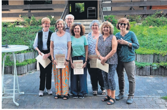
Ehrung der Mitglieder mit 55 Jahren Vereinszugehörigkeit.