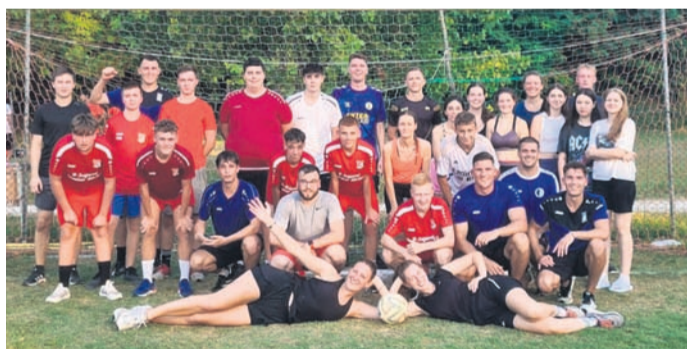
Beim Fußballspiel auf dem lokalen Fußballplatz.

Eppertshäuser Kolping-Jugend auf Ferienfreizeit