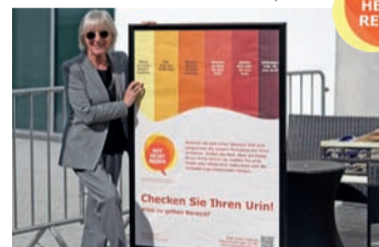
Schauspielerin Heidelinde Weis engagiert sich für Aufklärung.

Mehr Info: www.rotheisstreden.de Hotline: 08 00/7 24 36 22