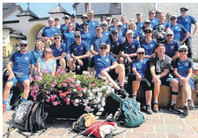
tags mit einem Live -Event auf dem Marktplatz. Alles in allem ein gelungener Jubiläumsausflug der den 38 Teilnehmern lange in Erinnerung bleiben wird.

Münster (MA) Die Wandergemeinschaft „Pipi Lala“ des SVM war zu Ihrem 10-jährigen Jubiläum dieses Mal in Abtenau unterwegs. Bei herrlichem Sonnenschein über die Gesamten Tage wurden wieder etliche Hütten und Almen in verschiedenen Schwierigkeitsstufen erwandert, wobei gerade im Jubiläumsjahr die Geselligkeit nie zu kurz kam. Abtenau wurde auch erkundet, donnerstags mit einer Ortsführung und frei-