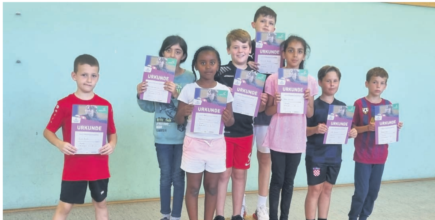
Die Sieger*innen des Ortsentscheids.

Nach dem Ortsentscheid kann es weiter gehen über den Kreis-, Bezirks- und Verbandsentscheid bis hin zum Bundesfinale 2024 für den ultimativen emotionalen Tischtennispaß.