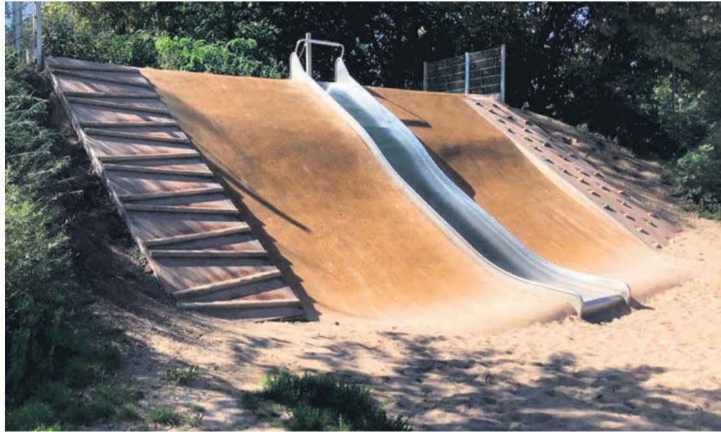
Der Rutschenhügel im Beethovenpark ist ein beliebtes Spielobjekt im Beethovenpark – jetzt steht eine Sanierung an.

Was wird gemacht? Aufgrund einer Vielzahl von Vandalismus-Schäden müssen Teile der Umzäunung geändert werden, zudem werden die Seitenflächen des Rutschenhügels mit vergossenem Fallschutz überzogen. Ebenso ist eine Neubefestigung der „Findlinge“, die der Hangabsicherung dienen, notwendig. Eine Sanierung im laufenden Betrieb ist leider nicht möglich. Erst wenn das sogenannte Fallschutzmaterial ausgehärtet ist, kann der Spielbereich wieder freigegeben werden. Zuletzt standen Arbeiten auf