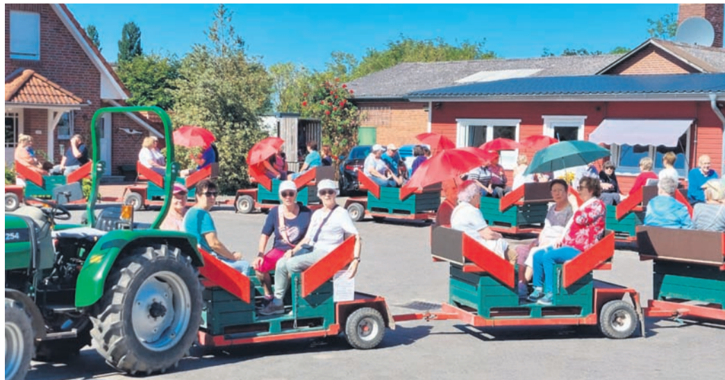
Erlebnissfahrt durch die Obstanlagen mit dem Apfelexpress. Mitten in der Natur wurde den Senioren vom "Obstbauern und Chef" persönlich erklärt, wie der Obstanbau im Alten Land heute betrieben wird.