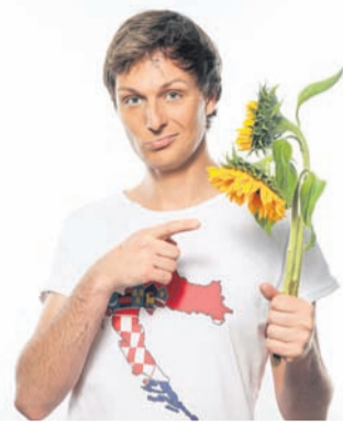
Und wieder einmal tritt Comedian Boris Stijelja in Obertshausen vors Publikum. Zuschauerinnen und Zuschauer dürfen sich auf „Viagra hält die Blumen frisch“ freuen.

Obertshausen (NZO) Auf ein Neues: Das Kleinkunstprogramm der Stadt Obertshausen startet am Freitag, 22. September, mit Boris Stijelja und seinem Programm „Viagra hält die Blumen frisch“. Los geht es um 20 Uhr im Bürgerhaus Hausen. Nach seinen Erfolgsprogrammen „Cevapcici to go“ und „Voll integriert - aber mein Schutzengel hat Burnout“ legt Deutschlands erfolgreichster kroatischer Comedian Boris Stijelja mit seinem dritten Programm nach – und wieder gastiert er in Obertshausen.