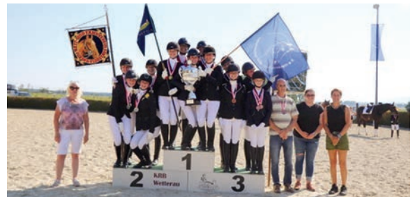
Die Mannschaft des Reitverein Leidhecken platziert sich vor Florstadt und der RSG Reichelsheim|Bliefeld.