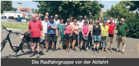
Die Radfahrgruppe vor der Abfahrt

Beim diesjährigen Florstädter Stadtradeln wurden zwei geführte Radtouren zum Kloster Ilbenstadt und zur Autorenlesung durchs Auenland von der Agendagruppe Verkehr bei strahlendem Sonnenschein durchgeführt.