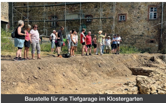
Baustelle für die Tiefgarage im Klostergarten

nieren, Singles und Familien sowie das vorgesehene Angebot für Orte zum Wohnen, Leben und Arbeiten fand bei der Radgruppe großes Interesse. Die Fahrstrecke betrug 22 km und endete mit einem gemeinsamen Essen im Bürgerhaus Florstadt. Eine zweite Tour führte die Radfahrer durch die Auen der Nidda, deren Tiere und Besonderheiten durch den Naturschützer Udo Seum erklärt wurden. Vögel, Wasserbüffel und ein aktiver Biber, der Grund für die Einzäunung von Naturschutzgebieten waren nur einige Themen, die an den Rastplätzen gezeigt und erläutert wurden. Am Zielort Auenlandhof in Dauernheim wartete im schattigen Biergarten bereits die Gambacher Krimiautorin Jule Heck mit ihrer Fabel „Die Störche“ auf die Gruppe. Anschließend fand sich genug Zeit für nette Gespräche und eine sehr schmackhafte Erbsensuppe. Nach der Stärkung ging es auf den Heimweg der insgesamt 27,5 km langen Strecke.