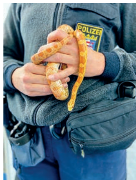
Eine Kornnatter retteten Polizisten in Friedberg

Tierisch ging es bei der Polizei am Montagabend (26.6.) zu. Gegen 23.45 Uhr fanden die Polizisten in der Straße „Vorstadt zum Garten“ eine Schlange auf der Fahrbahn. Das wechselwarme Tier hatte es sich offenbar auf dem Asphalt gemütlich gemacht, um in der Kühle der Nacht