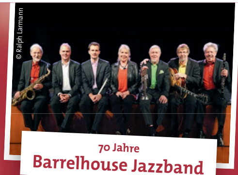
70 Jahre Barrelhouse Jazzband