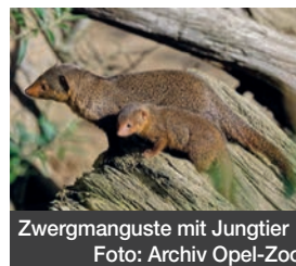
Zwergmanguste mit Jungtier

Ein Highballglas ist die kleinere Version von einem Longdrinkglas. Während in ein Longdrinkglas über 200 ml passen, hat das Highballglas nur eine Füllmenge von etwa 100 ml bis 140 ml. Falls ihr das kleinere Highballglas verwendet, passt ihr einfach Wodka und Orangensaft an.