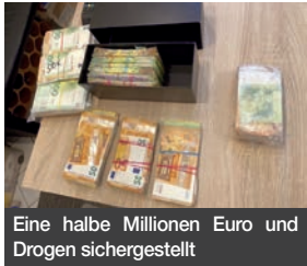
Eine halbe Millionen Euro und Drogen sichergestellt

Staatsanwaltschaft und Polizei ermitteln wegen Drogenhandels gegen zwei Wetterauer