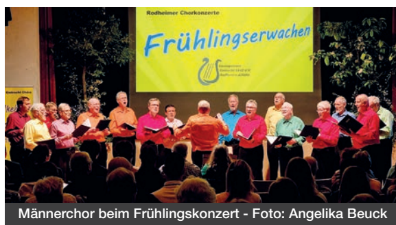
Männerchor beim Frühlingskonzert

Zusammen mit ihrer Kassenspartenleiterin Elke Schröder konnten sich die Verantwortlichen des Rodheimer Gesangvereins „Eintracht“ über einen kräftigen Zuschuss für die Vereinskasse freuen. Gleich zweimal war das Losglück den Rodheimer Sängerinnen und Sängern hold: Der Verein hat beim Förderwettbewerb der Volksbank Mittelhessen „Was einer allein nicht schafft“ 1.000 Euro gewonnen. Aus dem Reinertrag des VR-Gewinnsparevereins Hessen-Thüringen e.V. landeten außerdem weitere 250 Euro auf dem Konto der „Eintracht“. Darüber hinaus profitiert der Verein durch die Nutzung der IV-Anwendung „GLS Vereinsmeister“, das die Volksbank interessierten Nutzern für deren Mitglieder- und Finanzverwaltung kostenlos zur Verfügung stellt.