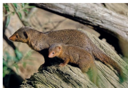
Zwergmanguste mit Jungtier

Redaktion Monatsjournal www.Monatsjournal.de Redaktion@Monatsjournal.de Südstraße 11, 61194 Niddatal