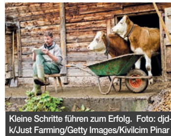
Kleine Schritte führen zum Erfolg.

Beispiel Landwirtschaft: Kleinbetriebe sollten auf kleine Schritte setzen