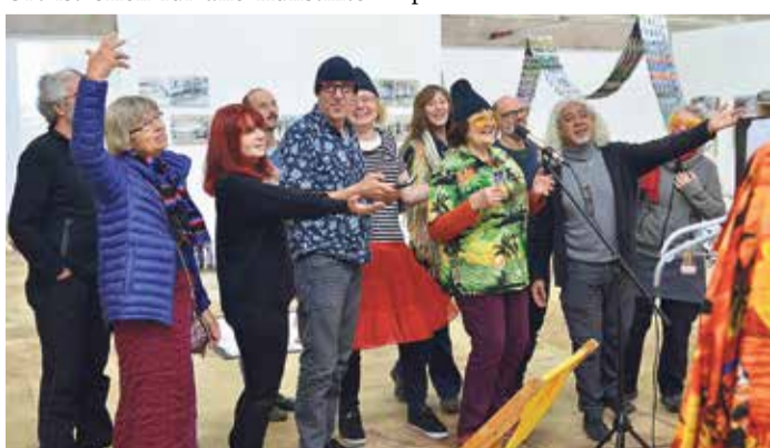
Mitglieder des Kunstvereins Eulengasse.

Die Ausstellung wird am 2. Oktober mit einer Vernissage um 17 Uhr im TOR Art Space in der Hanner Landstraße 161-171 eröffnet. Danach ist die Ausstellung 14 Tage geöffnet. Genaue Öffnungszeiten: www.eulengasse.de .