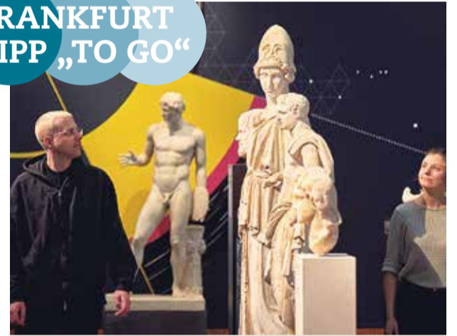
Sonderausstellung Maschinenraum der Götter im Liebighaus.