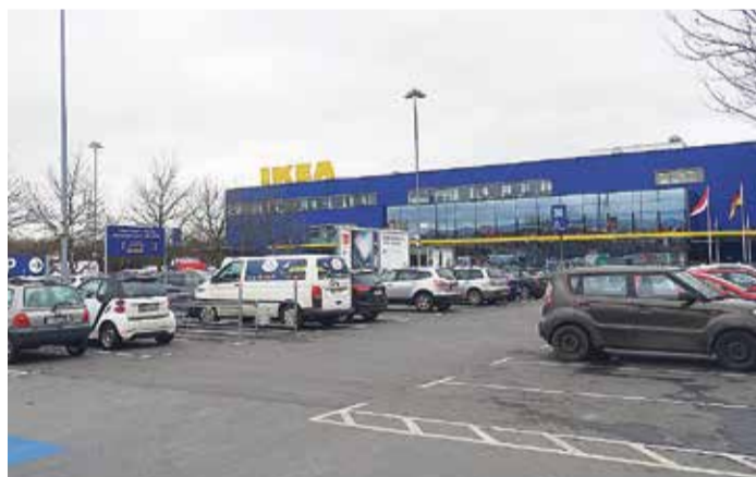
Im Gewerbegebiet von Nieder-Eschbach hat sich seit 2007 auch Ikea angesiedelt.

Die Otto-Hahn-Schule, seit dem 1. September 1969 in Nie-