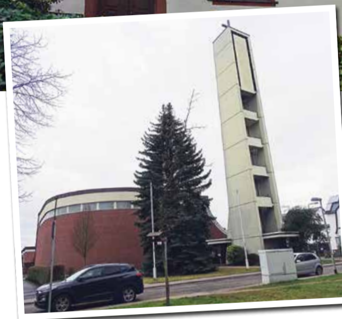
Die evangelische Pfarrkirche ist heute Kulturdenkmal.

Ein Stadtteil zwischen Tradition und Fortschritt