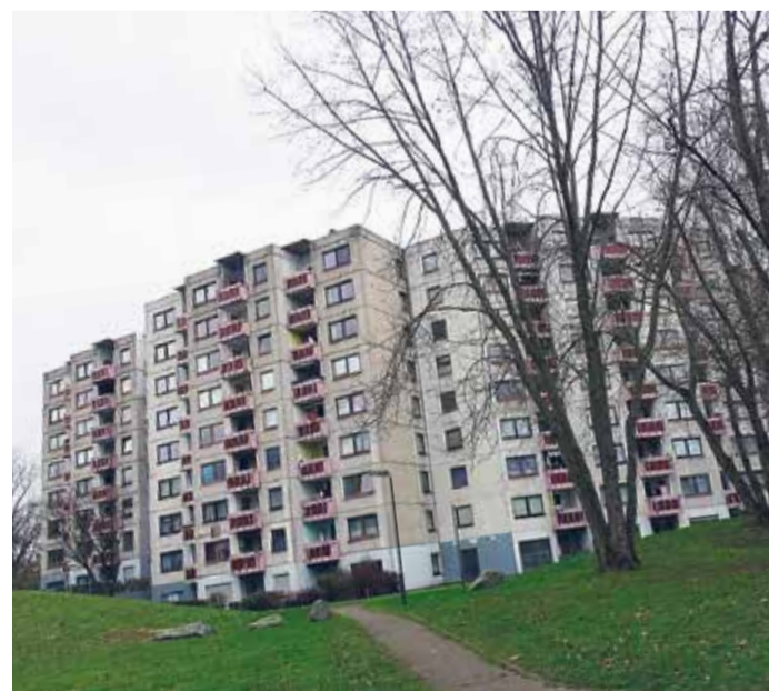
Der Ben-Gurion-Ring beherbergt etwa 6000 Menschen in insgesamt 1350 Wohnungen.