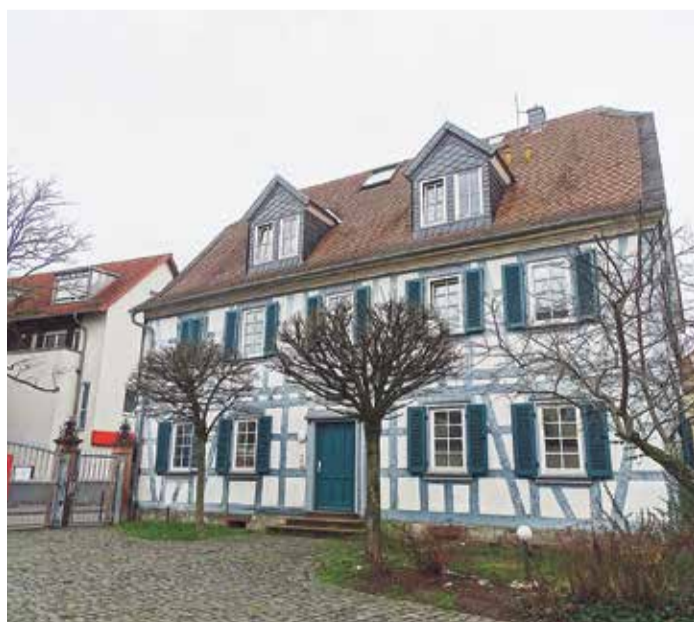
Ein wunderschönes Fachwerkhaus mit historischem Hintergrund: Die Hofreite.