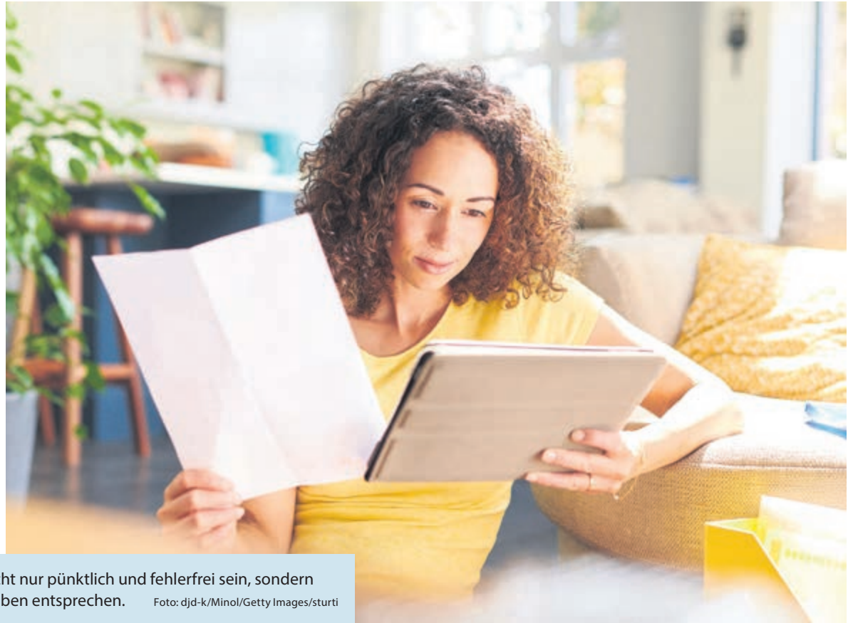
Eine Heizkostenabrechnung muss nicht nur pünktlich und fehlerfrei sein, sondern auch den aktuellen rechtlichen Vorgaben entsprechen.

(DJD-K). Mieter erwarten in Zeiten hoher Energiepreise eine gerechte und einfach verständliche Heizkostenabrechnung, sie muss zudem den aktuellen rechtlichen Vorgaben entsprechen. Ab Ende 2022 beziehungsweise Anfang 2023 gibt es vom Gesetzgeber neue Vorgaben. Hier ein Überblick, unter minol.de gibt es mehr Infos. 1. CO 2 -Kostenaufteilungsgesetz: Sowohl Vermieter als auch Mieter werden am CO 2 -Preis beteiligt. 2. Erdgas-Wärme-Soforthilfegesetz („Dezemberhilfe“): Wer in einem Mehrfamilienhaus wohnt, erhält die Entlastung in der Regel bei der nächsten Heizkostenabrechnung. 3. Energiepreisbremse: Bei Gebäuden mit Zentralheizung muss der Eigentümer die Entlastung über die Heizkostenabrechnung an die Bewohner weitergeben. 4. Erweiterte Informationen: Die Heizkostenabrechnung wird noch informativer.