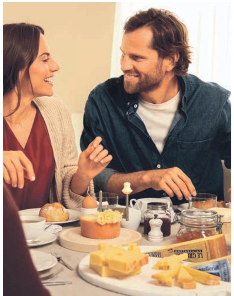
Schweizer Käse – Das Gute leben.