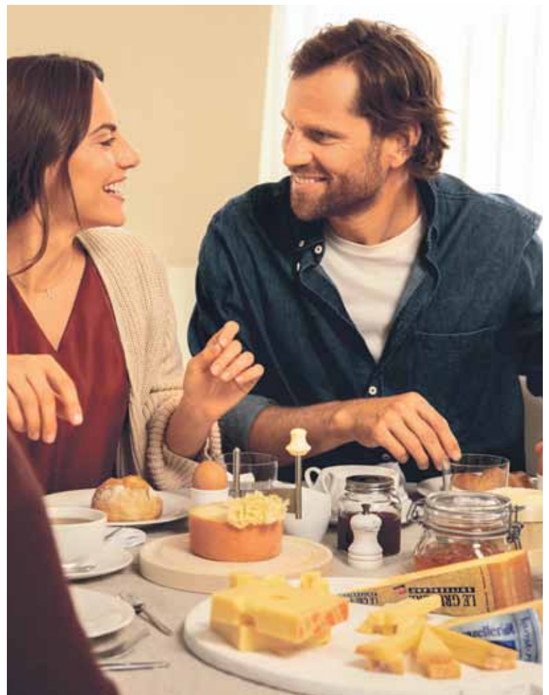
Schweizer Käse – Das Gute leben.