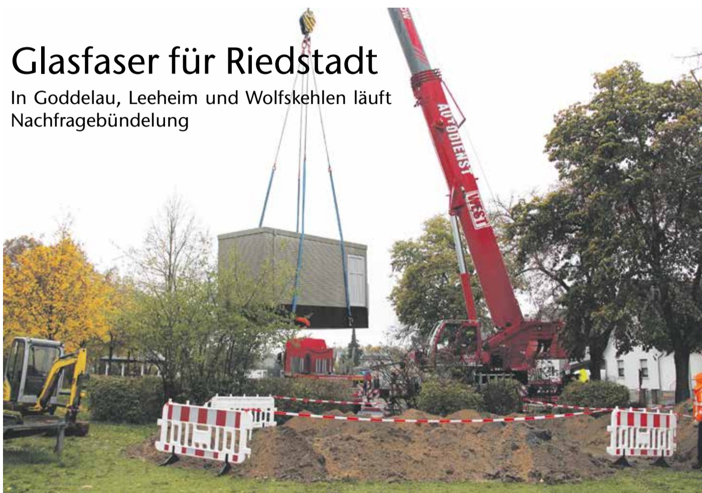
Im November vergangenen Jahres wurden in Crumstadt (Foto) und Erfelden die Hauptverteiler mittels eines Krans an Ort und Stelle gesetzt.

RIEDSTADT – In Crumstadt und Erfelden wird fleißig das moderne und zukunftsfähige Glasfasernetz ausgebaut.