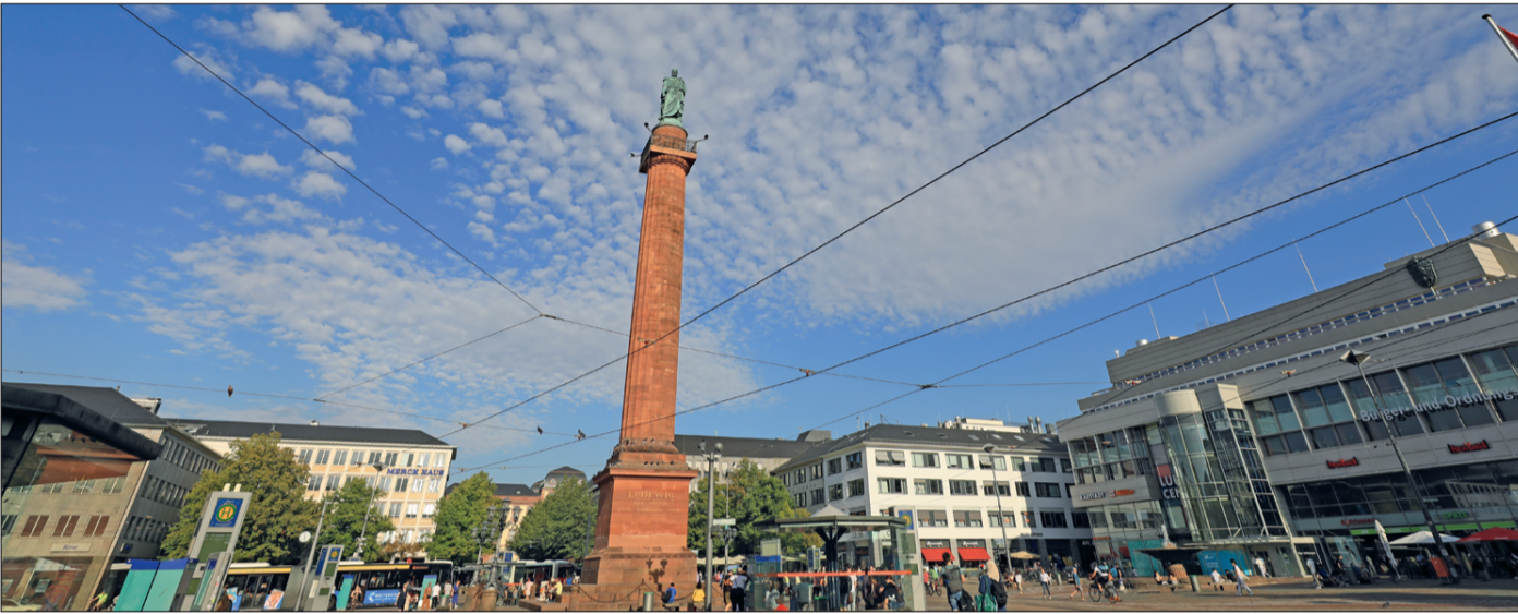
MESSREIHEN: In den vergangenen Monaten wurden Temperaturdaten in Darmstadt gesammelt.