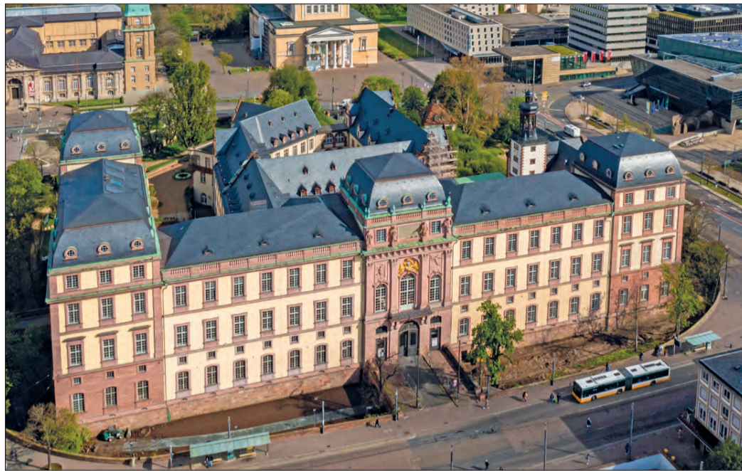
IM HERZEN DER WISSENSCHAFTSSTADT: Das sanierte Darmstädter Schloss.