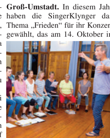
Die SingerKlynger bereiten sich auf ihr Friedenskonzert am 14. Oktober in Heubach vor.

In diesem Jahr haben die SingerKlynger das Thema „Frieden“ für ihr Konzert gewählt, das am 14. Oktober in Groß-Umstadt. In diesem Jahr haben die SingerKlynger das Thema „Frieden“ für ihr Konzert gewählt, das am 14. Oktober in Groß-Umstadt/Heubach zur Aufführung kommt. Das Thema Frieden hat viele Gesichter – dabei geht es nicht nur um die Abwesenheit von Krieg, sondern auch um Zwischenmenschliches im Allgemeinen, um Liebe, Beziehungen, aber auch um Streit und die Fähigkeit zu verbaler Auseinandersetzung und um gegenseitigen Respekt und Toleranz. Das alles soll in diesem Konzert vermittelt werden. Durch Lieder, aber auch durch Gedichte und instrumentale Stücke. Der Chor singt in unterschiedlichen Besetzungen, ergänzt durch solistische Beiträge. red