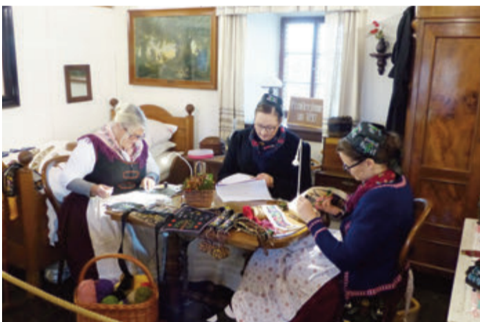
Frauen in der Nähstube.