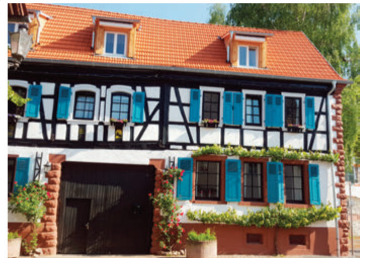
Fachwerkhaus in bestem Zustand.

Groß-Umstadt. Am Freitag, 29. September, findet ab 17 Uhr eine Fachwerkführung statt. Startpunkt der etwa 90 Minuten langen Führung ist das Rathausportal auf dem Marktplatz Groß-Umstadt. Die Führung dauert etwa 90 Minuten. Die Teilnahmegebühr für die Führung beträgt vier Euro. Die Teilnehmerzahl ist auf 25 Personen begrenzt. Eine Anmeldung