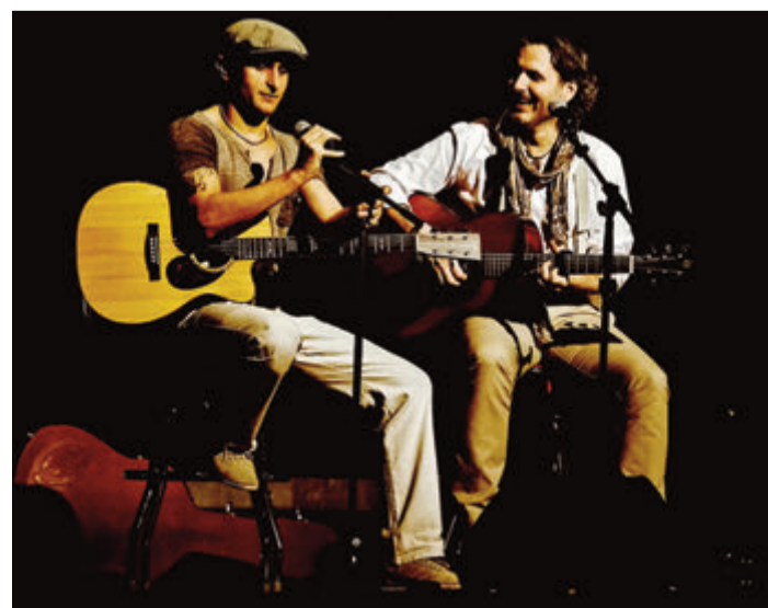
Zwei mit virtuosem Gitarrenspiel.

Groß-Umstadt. Freunde und Bewunderer all der beliebten Songs des US-amerikanischen Duos Simon & Garfunkel können sich auf den 21. Oktober freuen. Dann spielt die Simon + Garfunkel Coverband Graceland im Pfälzer Schloss mit großem Feingefühl und virtuosem Gitarrenspiel „Bridge over Troubled Water“, „Scarborough Fair“ und vieles mehr. Karten gibt es in Groß-Umstadt im UmStadtBüro, Bücherkiste und EXPERT Zwiener und bei allen bekannten Vorverkaufsstellen sowie online unter www.gross-umstadt.de. Einlass ist um 19 und Beginn um 20 Uhr im Pfälzer Schloss in der Pfälzer Gasse 16 in Groß-Umstadt. red