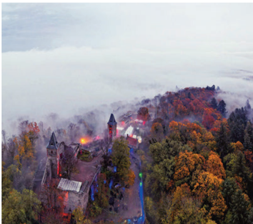
Burgruine im Nebel: Zum letzten Mal an diesem Ort findet die Halloweenparty auf Burg Frankenstein statt.

Auf 3000 Quadratmetern werden bekannte und neue Gruselattraktionen eingerichtet. Sorge für den Schrecken von „ES“ bis „Freddy Krueger“ trägt